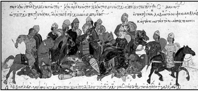
Іл. № 1. Мініатюра. Фрагмент візантійського рукопису XII ст., що показує половців. Зб. Мадридської національної бібліотеки

етнонім в перекладі з тюркської означає «глек для омовіння», себто посудину життя. Взагалі-то про згаданий народ з надзвичайно цікавою образністю відомі скупі дані. Сучасним знавцем походження людності та розвитку її стосунків з оточенням є С. Плетньова [4].