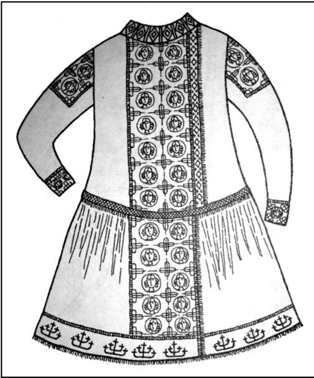
Іл. № 4. Реконструкція половецького каптана з Чунгульського кургану

орда, вдершись на Русь, «...взяша 6 городовъ Берендиць» [4]. Тобто кочові народи поступово вкорінювались, їх заняттями серед заможних представників стає торгівля і посередництво між Хозарією, Руссю, Візантією і грецькими колоніями, у тому числі работоргівля. Менш заможні осідають на землі [4].