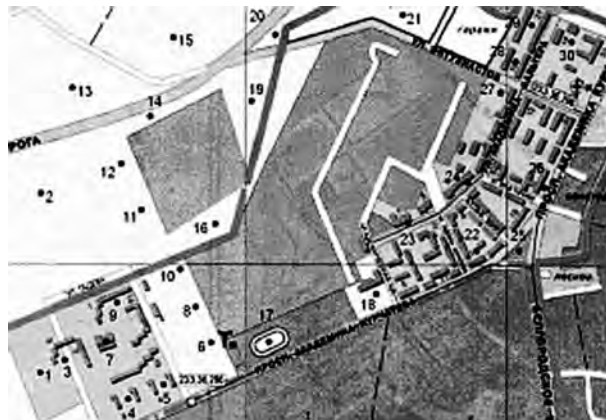
Рис.1. Карта изучаемой территории с нанесенными точками отбора проб (№№ 1–30).

Поскольку при решении экологических задач содержание 3,4-бензпирена в исследуемых объектах изменяется в широком диапазоне (от предела обнаружения данным методом до высоких концентраций), было разработано программное обеспечение, позволяющее оперативно изменять параметры установки. Предел обнаружения на данной установке составляет приблизительно 10^{-10} г/мл. Для количественного анализа использовался набор стандартных растворов в диапазоне концентраций от 0,125 \cdot 10^{-9} до 0,25 \cdot 10^{-6} г/мл, созданный на основе твердого стандарта 3,4-бензпирена (№ E71-04, Quality Assurance Materials Bank). Расчет концентраций осуществлялся с использованием програм-