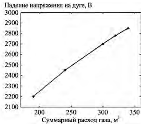
Рис.1. Зависимость напряжения на дуге от расхода плазмообразующего газа.

Так как длины дуги остаются приблизительно постоянными, можно сделать вывод, что с изменением соотношения расходов меняется проводимость дуги или плотность тока. Следовательно, изменение падения напряжения на дуге происходит вследствие изменения термо- и газодинамических процессов (режимов) течения