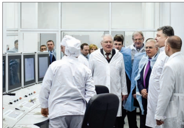
Візит Президента України П.О. Порошенка в ННЦ ХФТІ. 2016 р.