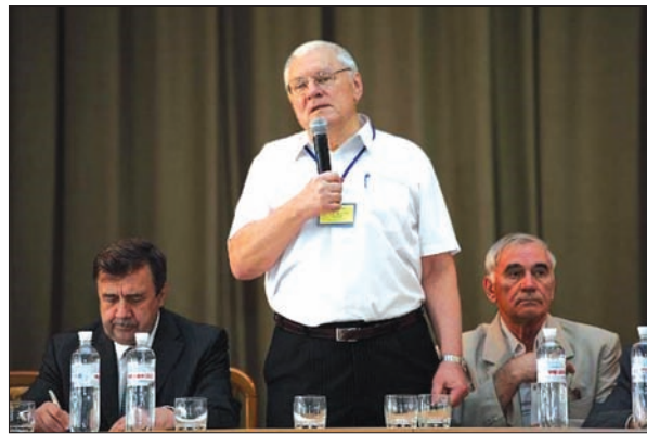
Головування на Міжнародній конференції з квантової електродинаміки та статистичної фізики QEDSP-2011; ліворуч — академік В.С. Бакіров, праворуч — академік І.М. Неклюдов. Харків, 2011 р.