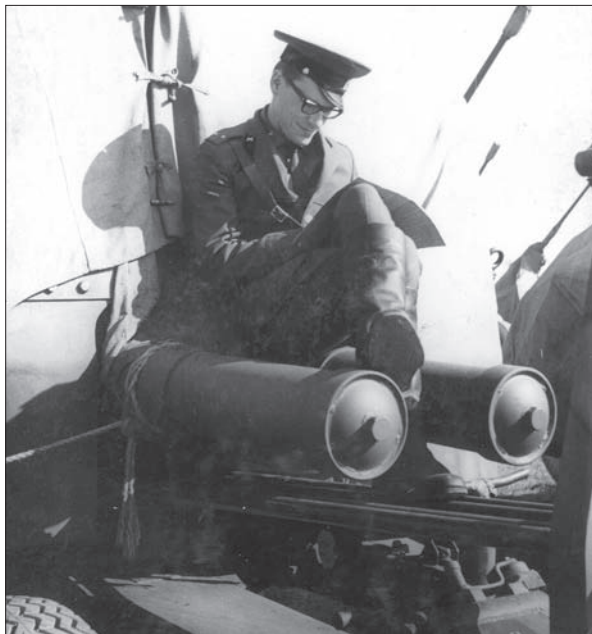
Так вивчалася «Квантова електродинаміка» Ахієзера і Берестецького. 1971 р.