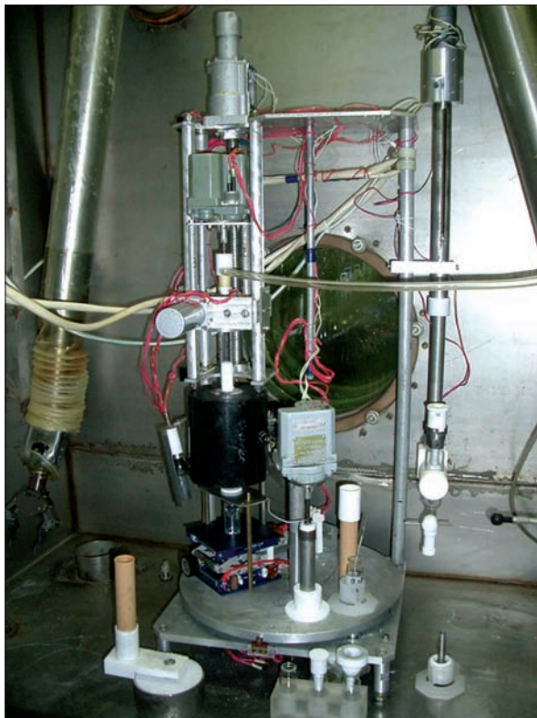
Рис. 4. Установка для виробництва капсул натрію йодиду ( ^{131}\text{I} )

Стурбованість суспільства дещо нівелюється зростанням продовольчої проблеми, зокрема необхідністю вирішення питань державного регулювання безпечності та якості харчових продуктів. Зростають потреби в консервуванні і зберіганні продуктів харчування за допомогою сучасних технологій, розробленні нових технологій, розбудові мережі сучасних лабо-