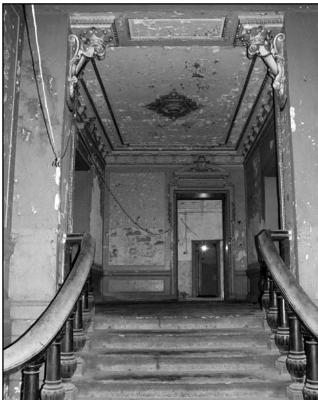
Інтер'єр парадного входу будинку