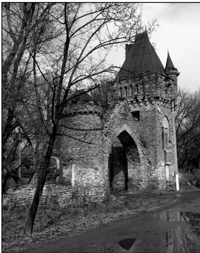
В'їзна брама до садиби Мсциховського

забудовуватися. У 1916 р. Г. Лукомський, журналіст та мистецтвознавець, відомий знавець української старовини, створив опис садиби та творів мистецтва в ній у журналі «Столиця і садиба» [6].