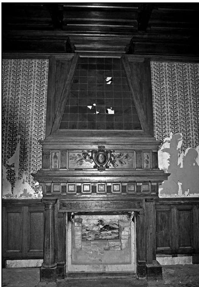
Камін в колишній мисливській залі

прикрашали французькі статуї, наприклад чавунні вази, що акцентували вхід, були відлиті в 1901 р. на Паризькому ливарному заводі та були точною копією мармурових, що зберігаються в Луврі [5, 105].