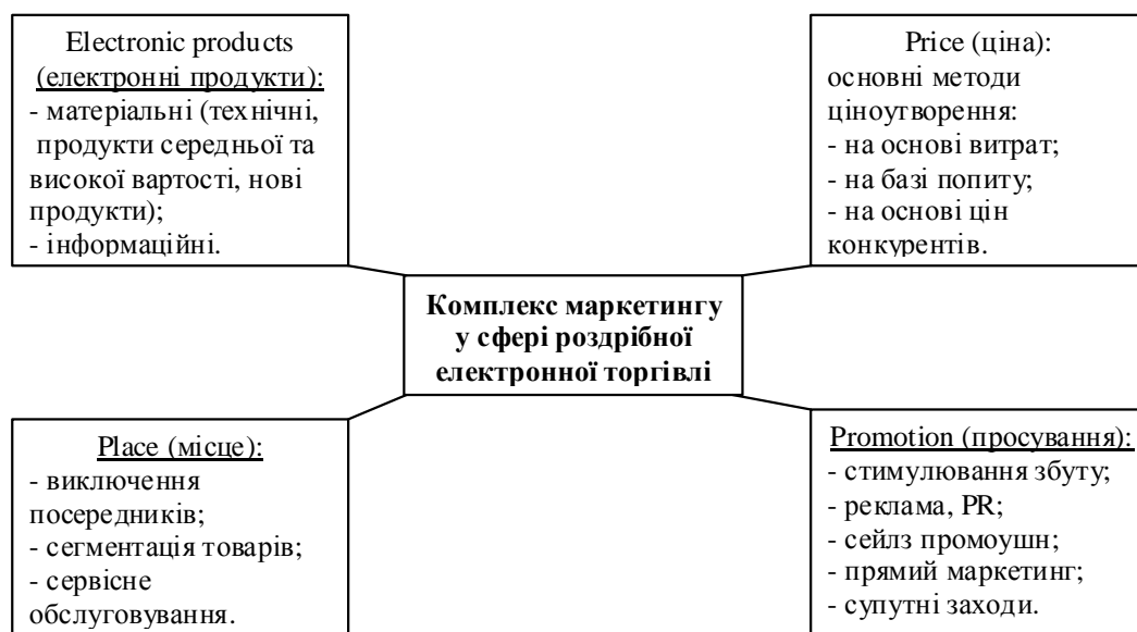
Рис. 1. Комплекс маркетингу підприємства, що працює у сфері роздрібною електронної торгівлі

При встановленні цін у роздрібною електронній торгівлі використовуються основні методи традиційного маркетингу: орієнтація на витрати, орієнтація на попит і кон'юктуру ринку, на основі цін конкурентів. Цінність товару у свідомості споживача підвищується тоді, коли роздрібною підприємство в мережі Інтернет