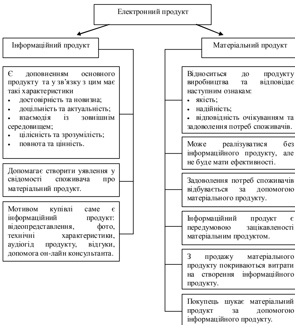
Рис. 2. Особливості електронного продукту

– вплив макроекономічних факторів на економічну ситуацію в країні в цілому та кризові ситуації в економіці.