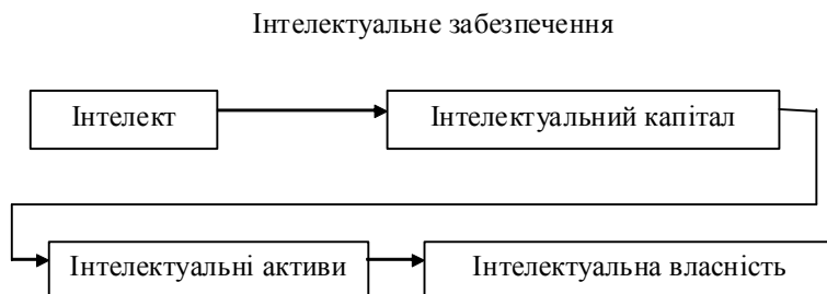
Рис. 4. Інтелектуальне забезпечення підприємства