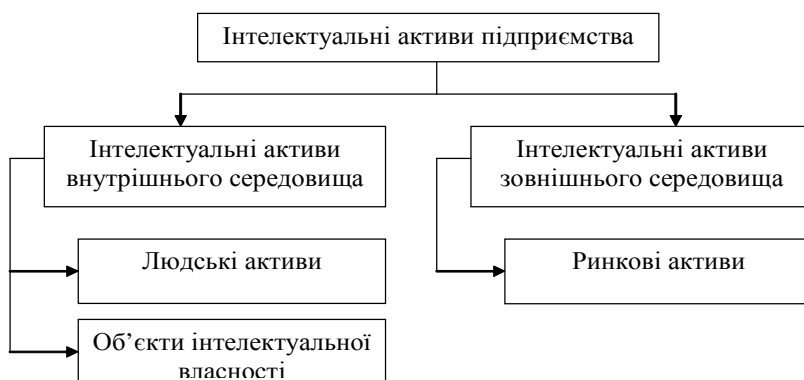
Рис. 3. Класифікація інтелектуальних активів підприємства

Мікрофакторами треба вважати споживачів (уподобання в асортименті продукції, тенденції розвитку, обсяги споживання, рівень платоспроможності), конкурентів (ступінь освоєння ринку, асортимент продукції конкурентів, ціна, якість, інноваційність пропонованої продукції), постачальників (види сировини, що поста-