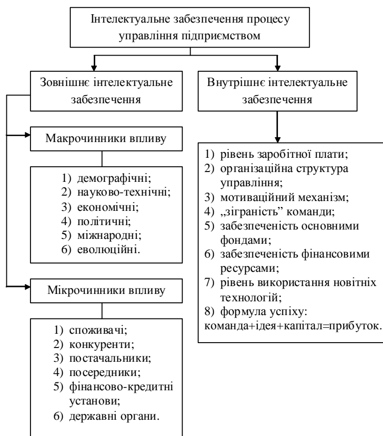
Рис. 5. Чинники формування інтелектуального забезпечення процесу управління підприємством