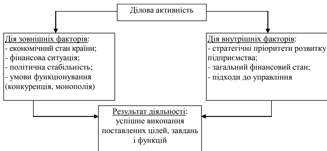
Рис. 1. Основні фактори, що впливають на ділову активність промислових підприємств