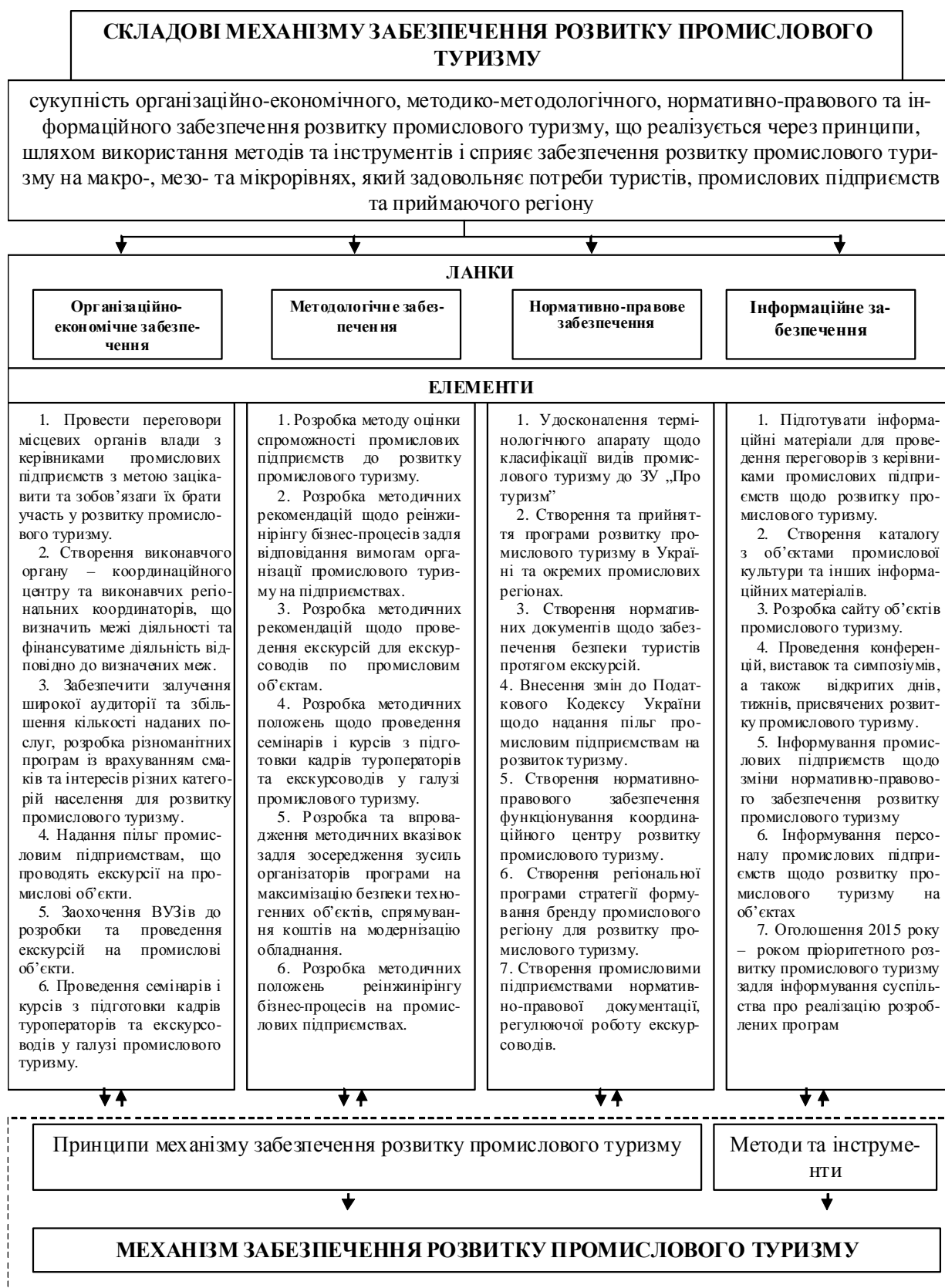
Рис. 2. Напрямки удосконалення механізму забезпечення розвитку промислового туризму