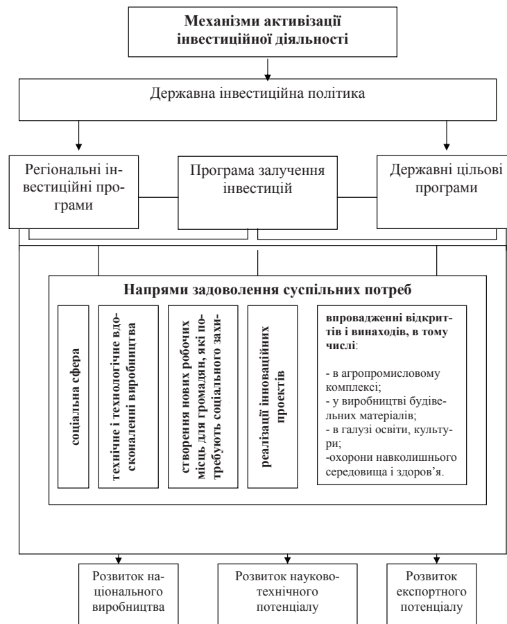
Рис. 2. Пріоритетні напрями залучення інвестицій

Так, за оцінками експертів в Україні інвестиційний рейтинг позитивний. Але більшість рейтингових агентств акцентують на необхідності створювати пільгові умови інвесторам, що здійснюють інвестиційну діяльність у найбільш важливих для задоволення суспільних потреб напрямках (рис. 2).