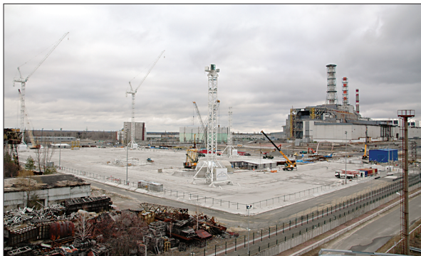
Будівельний майданчик нового безпечного конфайнменту