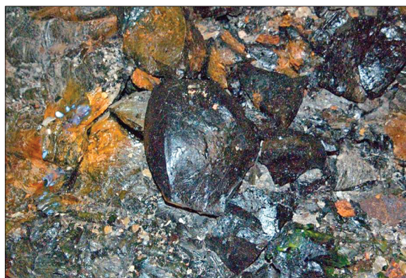
Деградація паливовмісних матеріалів на об'єкті «Укриття»

периментів, побудови аналітичних моделей і розрахунків.