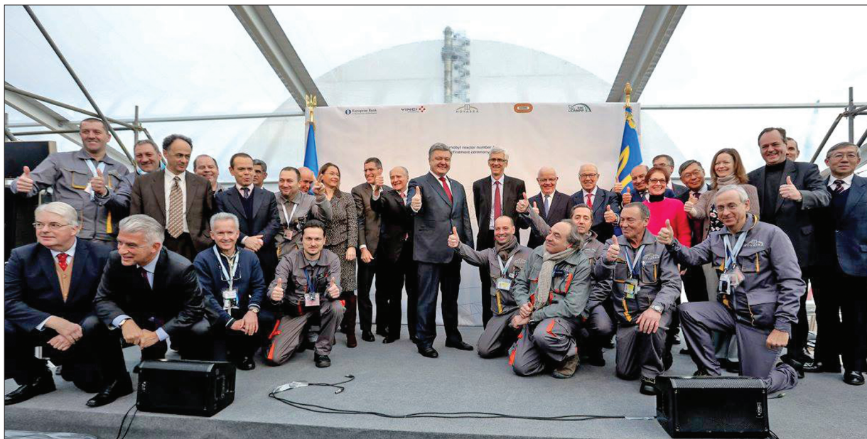
Урочиста церемонія з нагоди встановлення у проектне положення нового безпечного конфайнменту за участю Президента України Петра Порошенка. Чорнобиль, 29 листопада 2016 р.

Отже, одним із найважливіших завдань є розроблення технологічних рішень щодо вилучення паливовмісних матеріалів з використанням систем НБК та обґрунтування безпеки у процесі їх реалізації. Така попередня робота була виконана фахівцями ІПБ АЕС НАН України, і результатом її стали рекомендації щодо обов'язкового вилучення з об'єкта деяких небезпечних скупчень паливовмісних матеріалів [9].