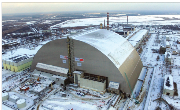
Арка — основна споруда нового безпечного конфайнменту

Слід врахувати, що після демонтажу нестабільних будівельних конструкцій об'єкта «Укриття», який необхідно починати відразу ж після введення в експлуатацію НБК, єдиним бар'єром, що перешкоджає поширенню радіоактивних речовин у навколишнє середовище, буде новий безпечний конфайнмент. Тому розроблення технології вилучення і контейнеризації паливовмісних матеріалів з метою створення додаткового бар'єра для ядерно безпечних матеріалів, які лежать фактично