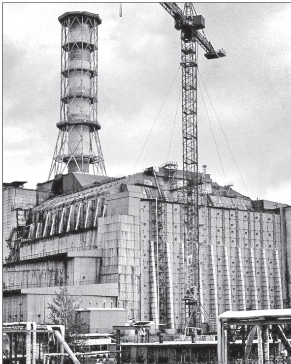
Законсервованій енергоблок № 4 Чорнобильської АЕС — об'єкт «Укриття»

встановлення місцезнаходження залишків ядерного палива, створення систем безпеки, діагностичних та експлуатаційних систем, визначення кількості ядерного палива, дослідження нестійких будівельних конструкцій аварійного енергоблока, розроблення стратегії перетворення об'єкта «Укриття» на екологічно безпечну систему та ін. [4].