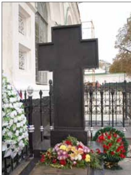
Могила П. А. Столипіна у Києво-Печерській Лаврі (12 жовтня 2011 р.).

сериди євреїв замечалось веселе настроєння духа, т. е. зустрічаєсь друг с другом і радушно передавали об цьому нещасному випадку. Це було в п'ятницю і ввечері по місту стало повне затишшє, тоді як по всьому по п'ятницям ввечері в Проскурові по Александровській вулиці єврейське гуляньє так, що вся вулиця переповнена, але в той вечір на цій вулиці майже нікого не було, а тільки ізредка прохаживали і то з якою-то обережністю» 6 .