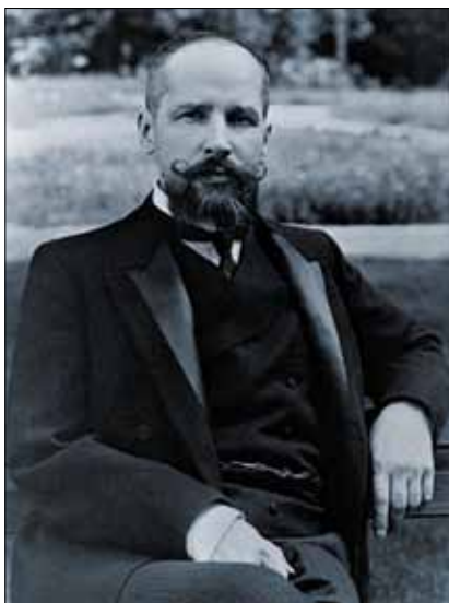
П. А. Столипін. 1907 р.

Фонди Центрального державного історичного архіву України, м. Київ (далі – ЦДІАК України) містять значну кількість документів, у яких відбилися події, пов'язані із замахом на життя та смертю Петра Столипіна, а також із ушануванням його пам'яті. Природно, що переважна більшість цих матеріалів відклалася у фондах Канцелярії київського, подільського і волинського генерал-губернатора, поліцейських та жандармських управлінь, оскільки обов'язком генерал-губернатора було керівництво усіма сферами життя підлеглих губерній, а функції поліції та жандармерії полягали, зокрема, у розслідуванні кримінальних справ.