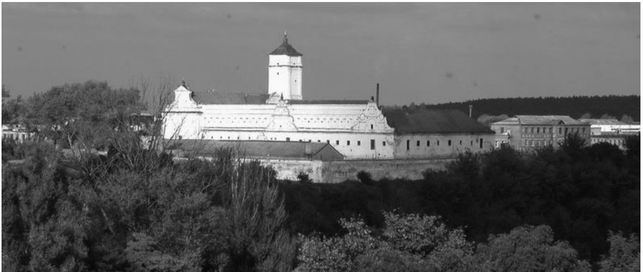
Панорама Бернардинського монастиря

ди (будівля костелу поч. XVII ст., вежа, закриті прилеглі коридори, мур перед костелом, будинок ліворуч від вхідної брами, т.зв. палацова каплиця, дзвіниця праворуч від вхідної брами, купольний павільйон із розп'яттям перед ним, надгробний монумент між палацовою каплицею і костелом); частина колишнього кляштора, яку було пристосовано до потреб Шепетівського Бупру (усі фасадні і внутрішні стіни, двори, коридори, келії, сходи, їдальня (рефекторум), прибудова біля дворового коридору, дерев'яні різьблені двірки біля всіх дверей. Також ККЮПК брало під охорону помешкання колишньої монастирської їдальні; орнаменти та забілені релігійні відображення, що знаходились у колишніх келіях монастиря тощо.