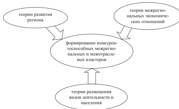
Рис. 1. Кластеры как неотъемлемый элемент составных частей теории региональной экономики

Изложение основного материала. При осуществлении региональной экономической политики в хозяйственном комплексе Украины и на местном (локальном) уровне, необходимо опираться на глубокое знание сущности кластеризации. Это тем более важно, что, несмотря на весьма распространенное представление об эффективности кластерных структур и отношении к ним как универсальному средству решения проблем развития регионов и муниципальных образований, нет общепринятого мнения о том, что такое кластер, в чем его суть и каковы принципы кластеризации. Академик РАН А.Г. Гранберг предложил в качестве составных частей теории региональной экономики рассматривать теории развития региона, теории межрегиональных экономических отношений и теории размещения видов деятельности и населения [13, с. 81]. Несмотря на то, что предмет и объект исследования каждой из этих теорий имеет определенную специфику, у них обязательно должны существовать точки пересечения. Одной из таких точек является формирование конкурентоспособных межрегиональных и межотраслевых кластеров (рис. 1).