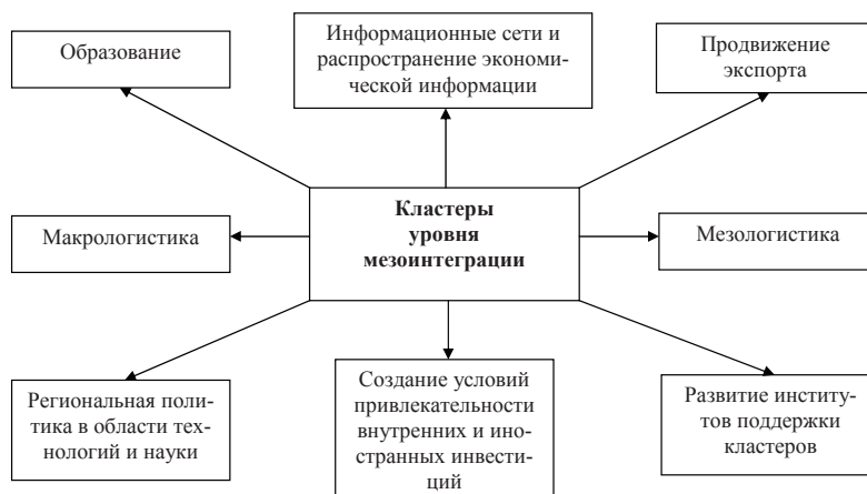
Рис. 2. Влияние кластеров, входящих в кластер уровня мезоинтеграции на общую экономическую политику

Перед Украиной стоят более сложные и многоплановые задачи, поэтому требуется комплексное знание о кластерном подходе, не ограниченное рамками интересов регионального развития. Кластерная структуризация региональной экономики оказывает существенное влияние на общую экономическую политику государства. Прежде всего это связано с поддержкой науки, рискованных инноваций, нанотехнологий, экспортной деятельностью, созданием необходимой инфраструктуры и образованием (рис. 2).