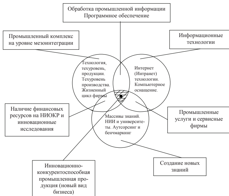
Рис. 3. Образование новых видов бизнеса в рамках кластера на уровне мезоинтеграции

стоять губительным тенденциям глобальной конкуренции. Примерами могут быть – кластеры на уровне мезоинтеграции – «Бенталор» в Индии, «Момпелье» во Франции, «Хагенберг» в Австрии, «Кембридж» в Великобритании, «Силиконовая долина» в США, «Дрезден – силиконовая долина XXI в.» в Германии и т.д. [10]. Корпоративным путем реализуется в промышленных кластерах на мезоуровне и региональная инновационная политика, что позволяет существенно уменьшить транзакционные издержки.