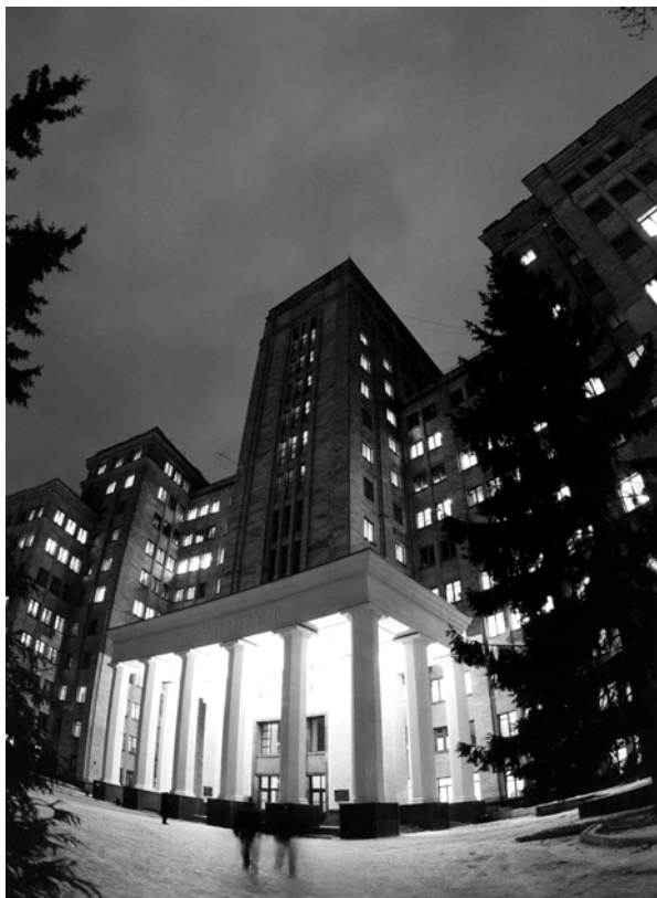
Головний корпус Харківського національного університету ім. В.Н. Каразіна

Наукову школу з територіальної організації продуктивних сил і регіоналістики створено за ініціативи академіка А.П. Голікова. Вона покликана науково забезпечувати регіональну економічну політику. Істотними розробками школи є регіональні особливості інноваційної діяльності, соціально-економічна стратегія формування в Україні нової моделі економічного розвитку, обґрунтування створення єврорегіону «Слобожанщина».