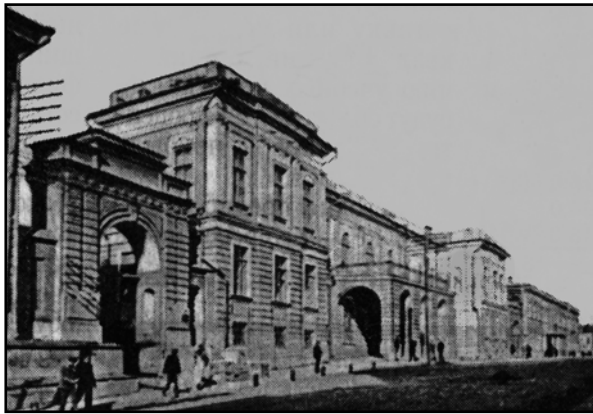
Дореволюційна будівля Харківського університету

заслуженою популярністю у викладачів Харківського, Московського та Казанського університетів.