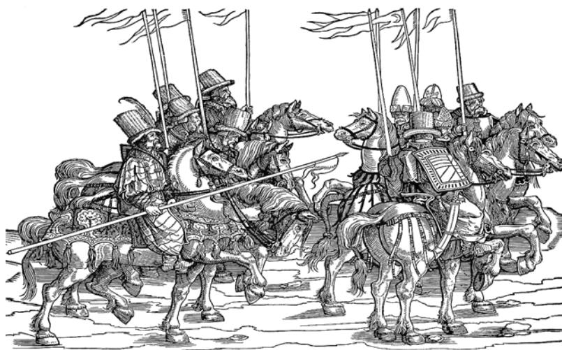
Рис. 4. Йорг Бреу-старший. Балканські вершники. Дереворит, 1530 р.