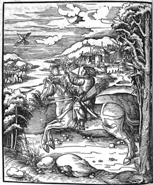
Рис. 7. Молодий Максиміліан Габсбург полює в спорядженні кінного лучника. Дереворит до автобіографічного твору імператора Максиміліана «Weisskunig», близько 1517 р.

султана, а разом з тим відкрито сповідує християнську віру.