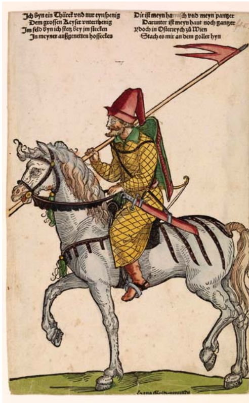
Рис. 2. Ніклас Штер. Турецький вершник. Дереворит, близько 1530 р.

новічні рицарські традиції. І тільки для найбільш бідних бояр Уставою був зроблений виняток на користь вогнепальної зброї. «А который бы бояринъ або мѣщенинъ не мѣлъ въ своемъ имѣнью людей такъ много, яко устава будеть, тотъ самъ предсе маеть ѣхати и служити; такъ тежъ которій не маеть пѣшотои зъ ручницею або зъ рогатиною». І в цьому прирівнював нобілітет до міщанин. Із зрозумілих причин закони не вимагали від рядової шляхти недешевого на першу третину XVI ст. латного обладунку, «зброї бляхової», «зброї зуполної». Натомість «хоружый, и гдѣ будеть хоруговъ держати, маеть на собѣ мѣти зброю добрую и гелмъ албо