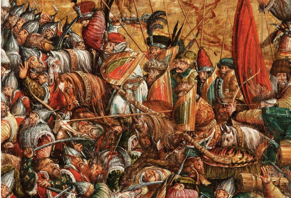
Рис. 8. Гусарський ротмістр попереду своєї хоругви. Фрагмент пам'ятки станкового живопису першої третини XVI ст. «Битва під Оршею», 1525–1535 рр. Національний музей у Варшаві, № МР 2575.