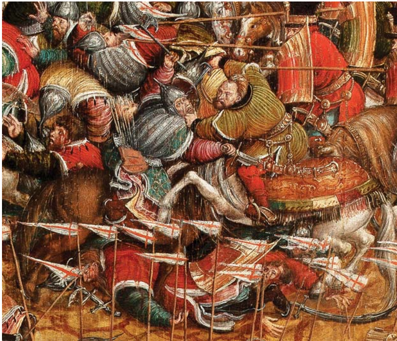
Рис. 9. Поєдинок гусара та московіта. Фрагмент пам'ятки станкового живопису першої третини XVI ст. «Битва під Оршею», 1525–1535 рр. Національний музей у Варшаві, № МР 2575.