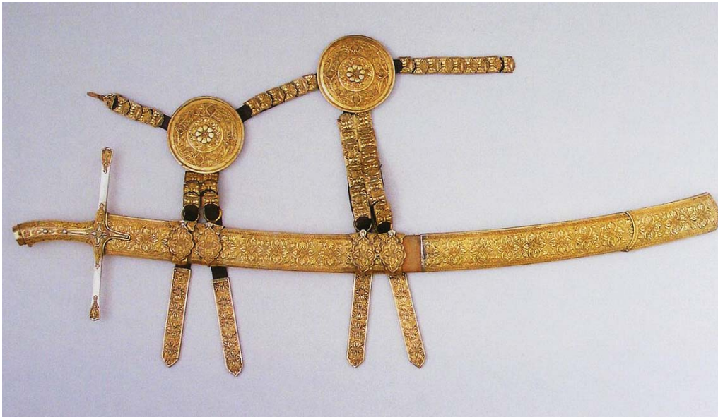
Рис. 10. Шабля ерцгерцога Фердинанда II Тирольського (р. ж. 1529–1595). Національний музей Угорщини, Будапешт, інв. № 55.3236.

Процеси, що відбувалися в першій половині XVI ст. у військовій справі Польсько-Литовської держави і на Русі в тому числі, були повністю інтегровані у загальноєвропейські тренди, тому не варто концептуально відділяти історію військової справи Західної Європи від Центрально-Східної, в тому числі від Польщі, Литви або Русі.