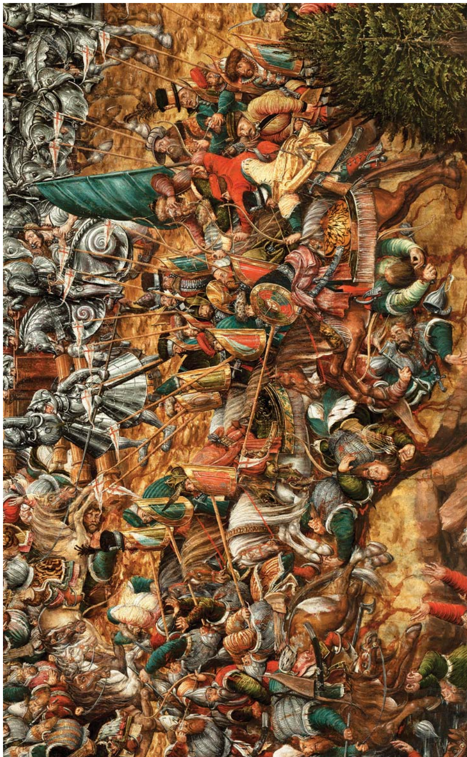
Рис. 6. Атака гусарської хоругви. Фрагмент пам'ятки станкового живопису першої третини XVI ст. «Битва під Оршиєю» 1525–1535 рр. Національний музей у Варшаві, № МР 2575.