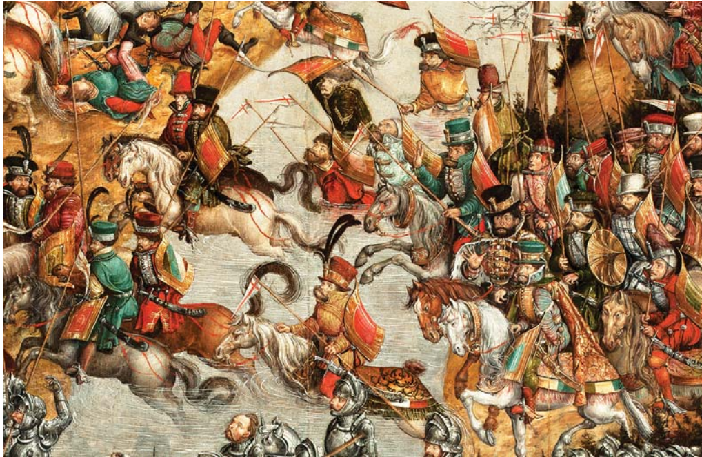
Рис. 1. Гусари на переправі через Дніпро. Фрагмент пам'ятки станкового живопису першої третини XVI ст. «Битва під Оршею», 1525–1535 рр. Національний музей у Варшаві, № МР 2575.

Комплекс озброєння, котрий зображено на фрагменті пам'ятки станкового живопису першої третини XVI ст. «Битва під Оршею» (рис. 1) у 1530-1560 рр. став пануючим трендом в середовищі шляхетської кінноти Великого князівства Литовського. Цьому маємо чіткі документальні підтвердження. Згідно «Уставу королівського і сеймового о наряді земського войська» від 1 травня 1528 р. комбатант, котрого військовозобов'язана шляхта повинна була виставляти з восьми служб власних маєтків, мусив бути «на добром коні, во зброї, з дровом с прапором; на котром би бил панцер, прилбица, меч або корд, сукня цвітняя, павеза і остроги дві» [4, с. 188].