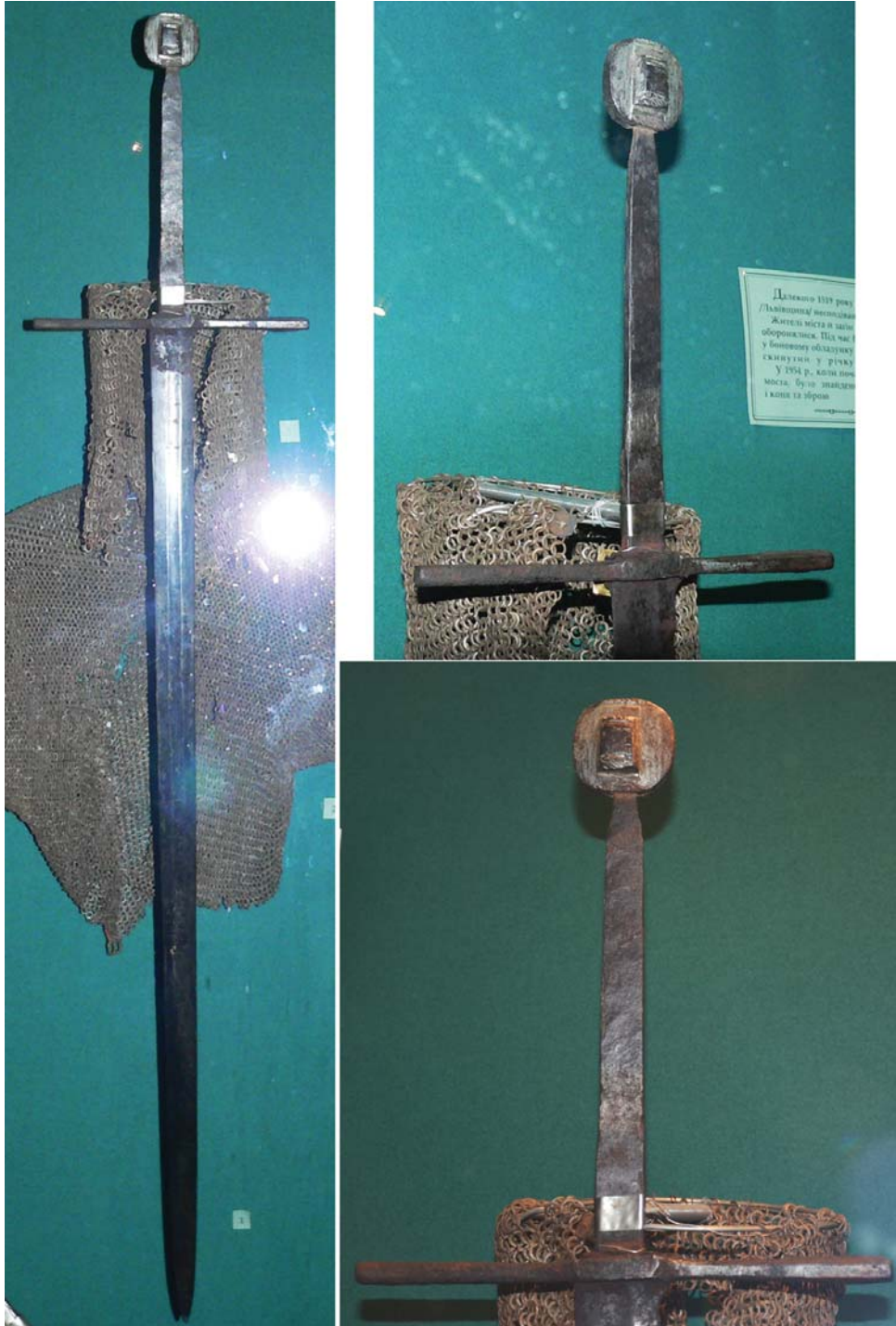
Рис. 4. Меч, найденный на берегу р. Западный Буг (Украина), посл. треть XIV–XV вв. ЛИМ, инв. № 3-2358.