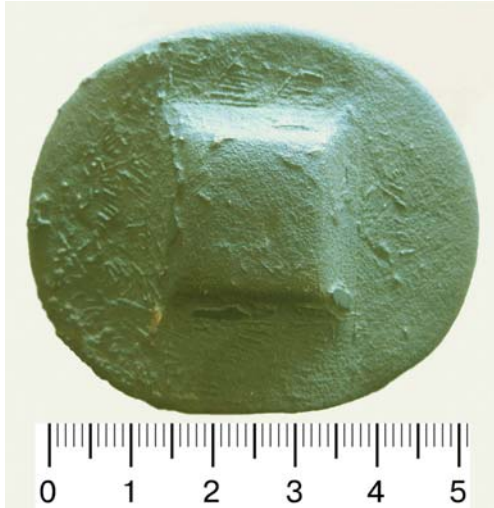
Рис. 7. Навершие меча, найденное у с. Харагыш (Молдова).