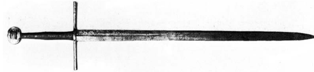
Рис. 2. Меч из собрания музея Фитцвильяма, сер. XIV века [22, р. 223, рис. 8].

fig. 18; 17, s. 145-146, Taf. 26, Nr. 53; 21, pl. 30 c, 31; 22, p. 210, nr. 3]. Опираясь на указанную типологию, подобное навершие, возможно, представляет собой вариацию формы К. Окшотт полагал, что такая форма появляются во 2 пол. XIII в. и в течении следующих 100 с небольшим лет широко представлена на мечах, после чего изредка встречаются до кон. XV в. [21, р. 96]. Собственно, дисковидное навершие с квадратным выступом английскому оружиеведу было известно только на мече из собрания музея Фитцвильяма (Кембридж, Англия) (рис. 2) и, без какой-либо аргументации, данный экземпляр датировался сер. XIV в. [22, р. 223, рис. 8]. Таким образом, навершие вместе с другими типологическими маркерами позволяют для рассматриваемого меча определить весьма большие временные рамки – XIV–XV вв.