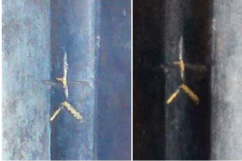
Рис. 4а. Клеймо на мече. ЛИМ, инв. № 3-2358.

житель поселка Борковичи нашел его в р. Дрисса, недалеко от деревни Горовцы [4, с. 28-31; 7, с. 319-320]. Белорусские коллеги, опираясь на известный им материал, датировали находку 2 пол. XIV–XV вв. [4, с. 31; 7, с. 320]. Однако Ю. Бохан, подробно описавший меч, обратил внимание на весьма интересную черту – клинок в сечении ромбический с вогнутыми гранями и выраженным ребром жесткости. По мнениям А. Брун-Хоффмейер и Э. Окшотта, подобные клинки начинают появляться ближе к кон. XIV в., а шире применялись в следующем, XV в. [15, t. I, s. 73-76, s. 89-92; 21, p. 58-59]. Поэтому временные рамки экземпляра из Белоруссии можно несколько сузить – кон. XIV–XV вв.