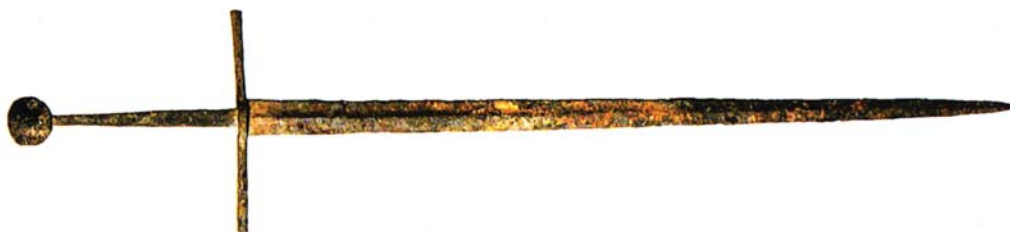
Рис. 5. Меч, найденный в р. Дрисса (Белоруссия), XV в. [5, с.141, мал.19].

Таким образом, приведенные аналоги позволяют нам внести некоторые коррективы. Во-первых, для рассматриваемого оружия они отодвинули верхнюю временную границу до 1 четв. XVI в. Во-вторых, если обратить внимание на два последних экземпляра, то увидим совершенно другие клинки. Они более узкие, с выраженным ребром жесткости, и, по своим функциям, в первую очередь предназначены для укола в менее защищенные участки корпуса и конечностей воина, облаченного в гомо-