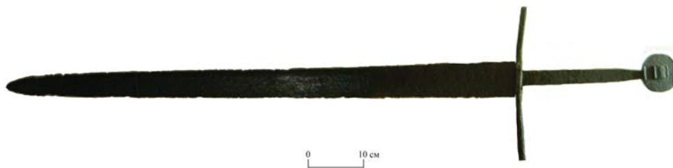
Рис. 1. Меч, найденный у с. Острожец, Ровенская обл. (Украина). РОКМ, инв. № 9021.

Эфес меча, состоящий из крестовины, навершия и хвостовика рукояти, сделан из железа. Крестовина длинная, средняя её часть выполнена в виде вытянутого прямоугольного бруска, от которого в противоположные стороны отходят дужки. Те, в свою очередь, несколько расширяются к окончанию. Вместе с тем дужки имеют не совсем характерную черту – они слегка изогнуты к навершию, тогда как у большинства крестовин подобный изгиб наблюдается в сторону клинка [15, t. I, s.186-194; 21, p. 112-119]. Навершие дисковидной формы. В середине имеется выступ в виде квадрата с двумя горизонтальными ребрами, вверху и внизу. Такое же ребро проходит вдоль нижнего края на-