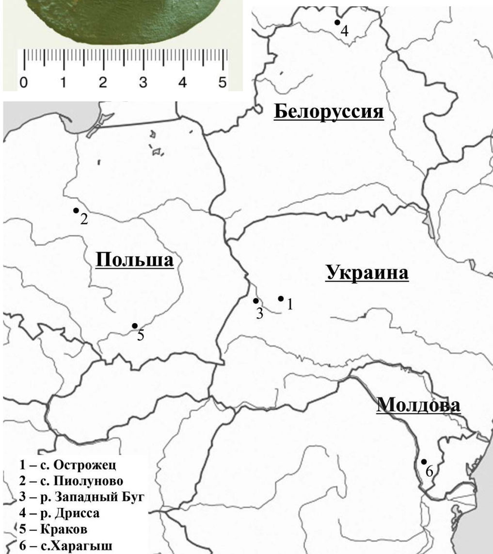
Рис. 8. Карта находок мечей и отдельных деталей «типа Пиолуново – Острожец».