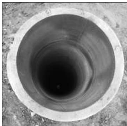
Рис. 6. Зовнішній вигляд водяного колодязя з бетонною стінкою