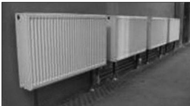
Рис. 7. Радіатори опалення «Corado Radik VK»

температури (підготовлена технічна вода) передбачено мембранний бак B Reflex об'ємом 25 л. Циркуляцію у системі опалення здійснює насос ЦН1 Wilo Star RS 15/8 . Реалізовано автоматичне виключення теплонасосної установки за допомогою датчиків SDF-3 тиску у разі розгерметизації контуру та втраті напору.