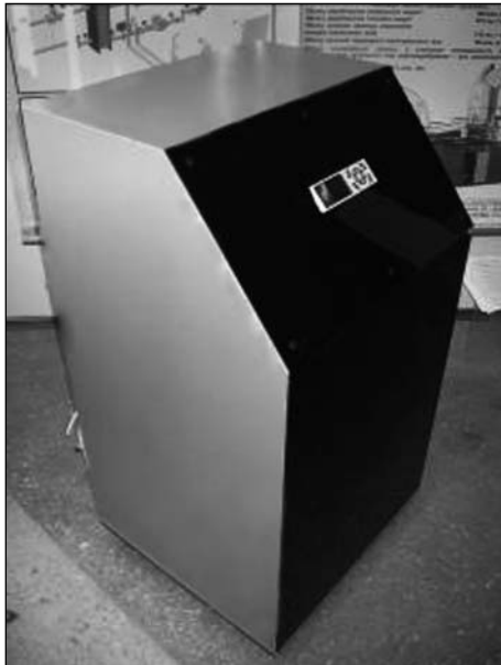
Рис. 3. Тепловий насос TH «VDE» TH-6

обох контурів вимірюється термоперетворювачами типу ТСП-002К і реєструється вторинними контрольними приладами.