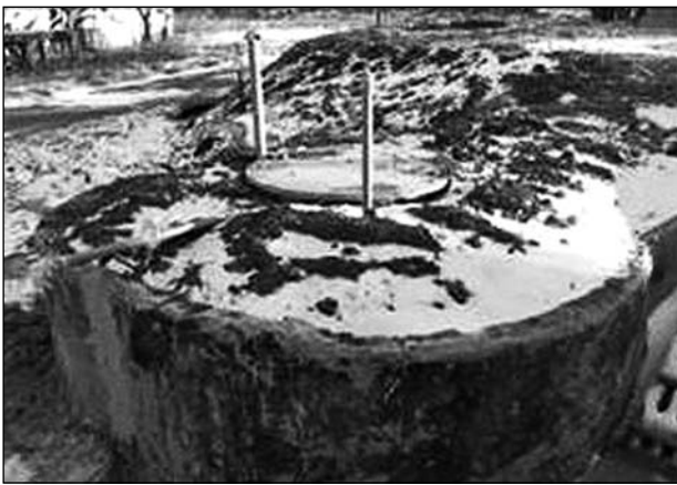
Рис. 2. Зовнішній вигляд водозабірної свердловини

ням та аналізом даних на комп'ютері для визначення кількості теплоти, що вилучена з ґрунтової води за допомогою теплового насоса, і кількості теплоти, що подана у систему опалення відповідно. В обох контурах встановлені також випускники для видалення повітря при заповненні системи і її роботі. Для проведення наукових досліджень ефективності роботи теплового насоса температура теплоносія у прямому та зворотному трубопроводах