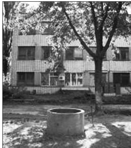
Рис. 5. Розташування колодезя на території ІТТФ НАН України

На території ІТТФ НАН України облаштовано водяний колодезь глибиною 17,6 м (рис. 5). Стінка колодезя складена з бетонних кілець діаметром 960 × 80 мм (рис. 6). Дебет води, яку можна використовувати як технічну або питну, складає близько 0,5 м 3 /год. У стовпі води висотою понад 0,5 м від дна розташовано напірний насос заглибленого типу із водозабірним фільтром грубого очищення із запірною регулюючою арматурою та контрольно-вимірювальними приладами (насосна станція Saer