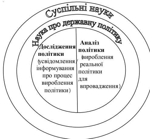
Дисциплінарні рамки науки про [державну] політику

Останнім часом українські політологи звернули увагу на аналіз політики як на важливу субдисципліну, що використовує значну кількість методів дослідження, підходів, характеристик тощо інших споріднених наук, а також завдяки таким важливим суспільним стимулам, як: