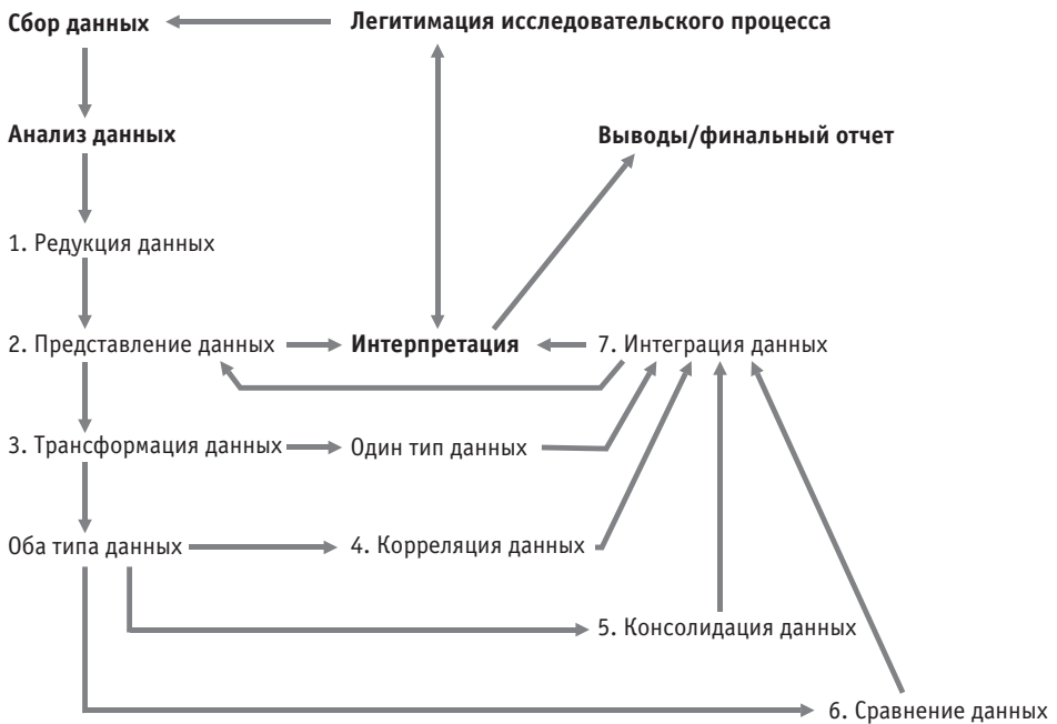
Рис. 2. Исследовательский процесс в рамках подхода исследований смешанного типа

Редукция данных зависит от их типа. В случае количественных данных она осуществляется с помощью описательной статистики, эксплораторного факторного анализа, кластерного анализа и других пригодных для этого методов. Если необходимо редуцировать качественные данные, то используется одна из разновидностей тематического анализа 1 .