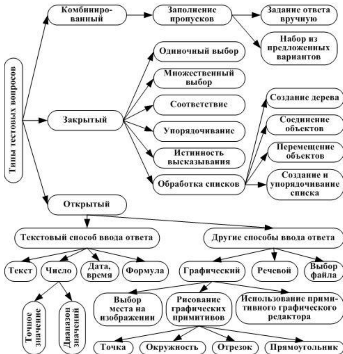
Рис. 1. Классификация тестовых вопросов

2. Множественный выбор – выбор одного или нескольких вариантов.