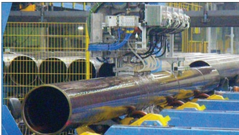
Установка АУЗК на заводе компании «Laubinger» во время приемочных испытаний, 2014 г.