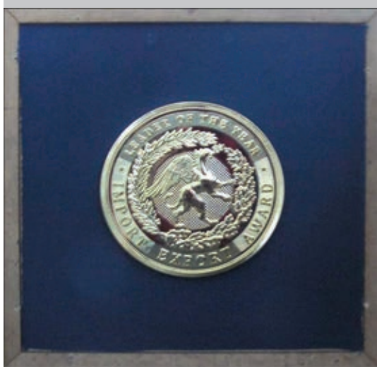
Сертификат «Экспортер года»

тификат. В этом же году была проведена сертификация нашего оборудования специалистами американской компании «ExxonMobile».