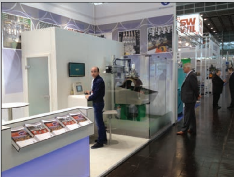
Презентация нашей новой технологии АУЗК бесшовных труб на международной трубной выставке в Дюссельдорфе, 2014 г.

То ли случай, то ли некоторое везение, но в этот момент в крупной не-