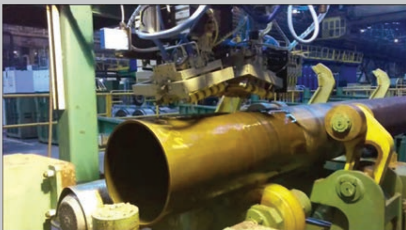
Установка НК 368ВЛ для АУЗК концевых участков бесшовных труб, ОАО «Волжский трубный завод», 2014 г.

Это была принципиально новая и сложная для нас работа, которую мы выполняли совместно с французской фирмой «Socomate», поставившей дефектоскопическую аппаратуру. Две такие установки были изготовлены для Волжского трубного завода: одна для концевых участков труб, вторая — для тела трубы. В этих проектах нами впервые была применена технология матричных фазированных решеток. Разработана принципиально новая конструкция акустических блоков с применением полиуретановой мембраны, скользящей непосредственно по поверхности трубы. Сегодня можно с уверенностью сказать, что аналогов такого оборудования в мире нет. Наша установка НК 380Л успешно прошла квалификационные испытания по стандартам фирмы «Shell» и ей выдан соответствующий сер-