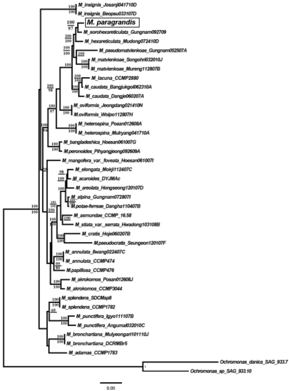
Схема филогенетического древа, построенная В1 методом на основе совместного анализа нуклеотидных последовательностей 18S рДНК, 28S рДНК и rbcL . Сверху (над дробью или ветвями) – байесовская апостериорная вероятность, снизу (под дробью или ветвями) – значения ML бутстрепа

филогенетических деревьев в МР оценивали методом бутстрепа, используя 1000 бутстреп-реплик. Для В1 выбраны следующие пара-