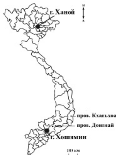
Карта-схема района исследований