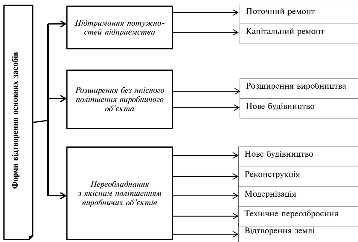
Рис. 1. Форми відтворення основних засобів