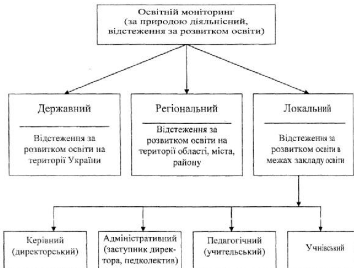
Мал. 2. Класифікація освітнього моніторингу за об'єктами відстеження.

Отже, за об'єктами, розвиток яких відслідковується, освітній моніторинг можна класифікувати, як на мал. 2.