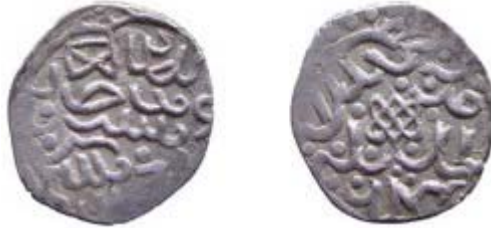
Наслідування карбуванню хана Токтамиша, Сарай ал-Джедід, 782 р.х. (Сумська обл.) 56 .