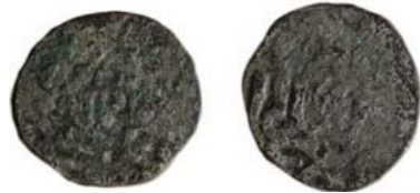
Наслідування карбуванню хана Токтамиша, (?) Сарай ал-Джедід, 782 р.х. (Чернігівська обл.) 54 .