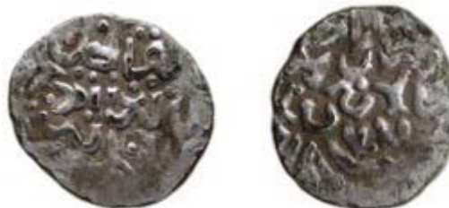
Наслідування карбуванню хана Гійас ад-Дін Мухаммеда, Орда, 772 р.х. (Чернігівська обл.) 58 .