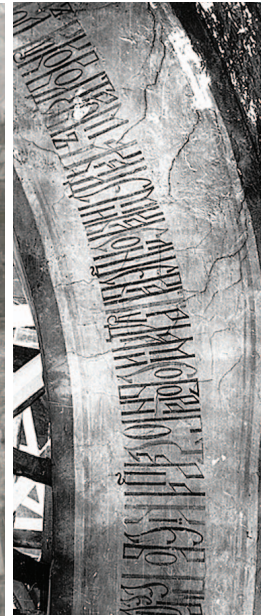
Ілюстр. 2 Фрагмент напису на честь реставрації 1851 р. (за Т.Рясною)