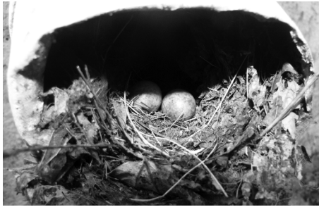
Рис. 2. Гніздування вільшанки у водостічній трубі будинку у навчально-спортивному таборі «Гайдари».