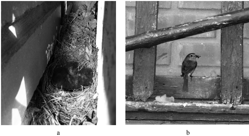
Рис. 1. Гніздування вільшанки за пожежним щитом на будинку у навчально-спортивному таборі «Гайдари» (НПП «Гомільшанські ліси»): а - гніздо; б - самка з кормом.

У природних умовах вільшанка гніздиться у приземному ярусі, для розміщення гнізд використовує розщелини кореневих шийок дерев та заглиблення між коренів вітровальних дерев, ніші та незначні пустоти у схилах лісових ярів. Її пристосуванням до розмноження у трансформованому ландшафті є розміщення гнізд у нішах природного та антропогенного походження: вигнилих дуплах фаутного деревостану, інколи птахи можуть займати штучні гніздівлі з великим льотком (діаметром понад 10см). Цікавими є факти гніздування вільшанки у спорудах людини. Так, у 2003 році пара гніздилася у трубі огорожі одного із таборів відпочинку. Щорічно з 2005 року ще одна пара розмножується за пожежним щитом на території навчально-спортивного табору педагогічного університету (рис. 1). У 2007 та 2013 роках птахи успішно вивели молодняк у водостічній трубі одного з будинків табору (рис. 2). При розмноженні у нетипових місцях вони переходили від наземного гніздування до розміщення гнізд на значній від землі висоті, від 0.4 м (водостічна труба) й 1.3 м (пожежний щиток) до 1.5 м (природні дупла та штучні гніздівлі).