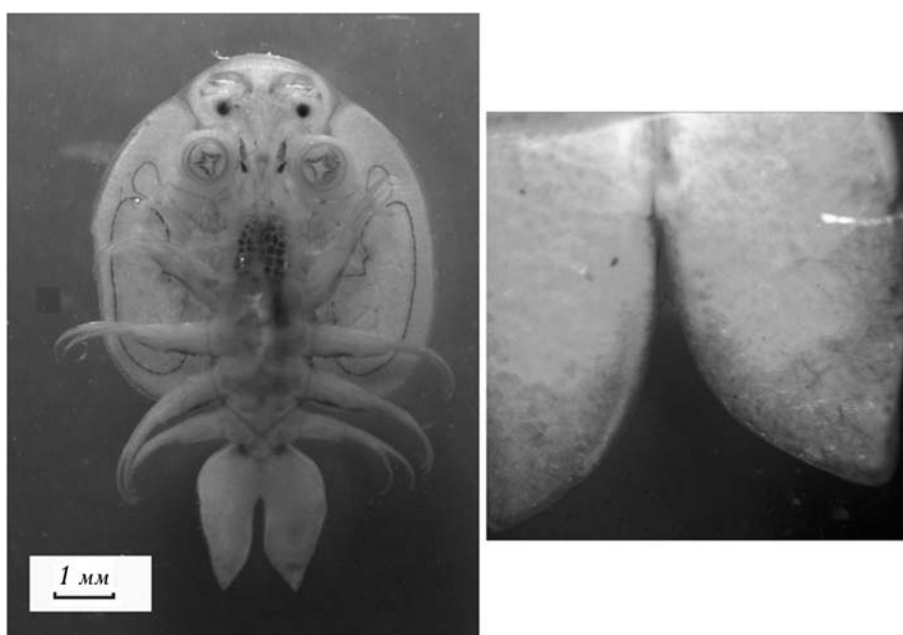
2. Вид самки A. coregoni с брюшной стороны.

В пробах дрефта также были выявлены 19 таксонов беспозвоночных. Наиболее качественно богатым было семейство Chironomidae (11 таксонов).