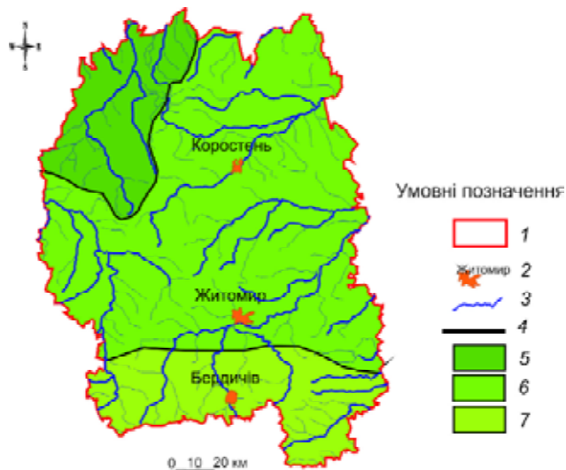
Рис. 2. Схема районування території Житомирської області за синхронністю багаторічного режиму рівнів ґрунтових вод: 1 – межі адміністративної області; 2 – населені пункти; 3 – річки і водотоки; 4 – умовні межі районів, де спостерігається багаторічна синхронність мінливості рівнів ґрунтових вод; 5 – район північно-західної окраїни Житомирського Полісся в умовах надмірного зволоження; 6 – район Центрального Полісся в умовах достатнього зволоження; 7 – перехідний район до зони лісостепу

Разом з тим чіткі межі територіальної синхронності не простежуються, що пов'язано з існу-