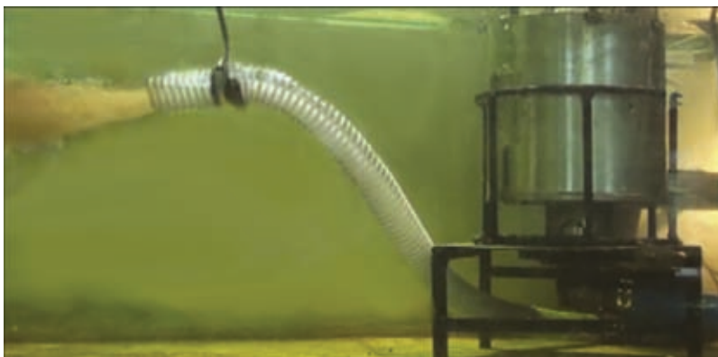
Соединение аварийной скважины с модулем для дальнейшей транспортировки жидкости по трубопроводу

в одном из известных ныне запатентованных изобретений предложенный нами принцип не применяется. На основе этого принципа коллектив ученых разработал аварийный модуль специальной конструкции, чем-то напоминающий стыковочный модуль космического корабля. Он присоединяется к месту утечки, компенсируя динамический удар вытекающего вещества, и осторожно перенаправляет поток в необходимом направлении. Таким образом, и вытекание прекращается, и добычу можно продолжить. Модуль может устанавливаться роботами или же сам быть роботом.