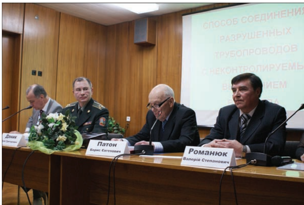
Выступление академика Б. Е. Патона

Катастрофа вынудила ведущие страны мира предпринять беспрецедентные меры, направленные на создание новых подходов к обеспечению безопасности при добыче углеводородов на морских шельфах. Лидеры стран-членов Большой двадцатки уделили этому вопросу особое внимание на саммите в Торонто, что нашло свое отражение в тексте коммюнике. Страны Европы,