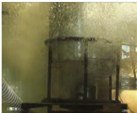
Процесс соединения модуля с аварийной скважиной в гидробассейне