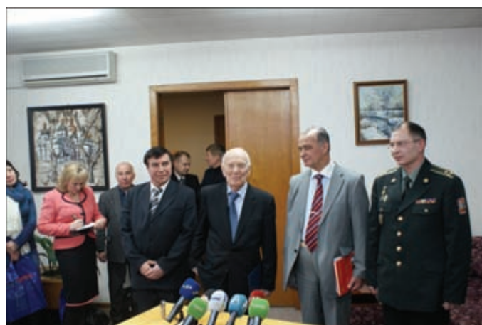
Авторы разработки отвечают на вопросы журналистов

Украина последовательно проводит политику обеспечения международной экологической безопасности, поддерживает инициативы государственных и негосударственных организаций по предотвращению аварий и экологических катастроф, связанных с добычей углеводородов, как наиболее опасных для нынешнего времени и будущего человечества, ведет активные разработки в этой сфере. Наше государство обратилось к ми-