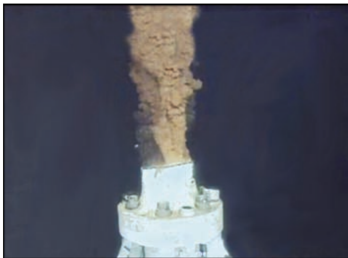
Фрагмент аварийного выброса нефти из скважины в Мексиканском заливе

которые имеют свои территориальные воды, решили пересмотреть правила для компаний, занимающихся добычей нефти и газа на их шельфах. Реакция правительства России на аварию в Мексиканском заливе также не заставила себя долго ждать. Она много в чем повторяет подходы американской стороны. Через месяц после катастрофы в Мексиканском заливе российский президент дал поручение правительству разработать законопроект «О защите морей России от нефтяного загрязнения», который должен регулировать вопросы обязанностей и ответственности добывающих компаний в случае загрязнения нефтью российского шельфа.