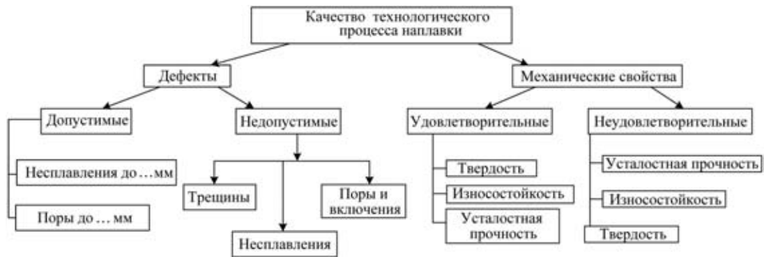
Рис. 2. Структурная схема оценки качества и надежности технологического процесса наплавки

выделить допустимые дефекты. Как показывает практика, во многих случаях дефекты появляются вследствие отклонений от установленных режимов процесса наплавки. Для определения качества процесса наплавки систематизируем причины, вызывающие рассмотренные выше дефекты. Согласно [1–6] основными причинами, приводящими к появлению дефектов при наплавке, являются некачественная подготовка материалов и поверхности восстановительной детали; неправильно подобранные сочетания материалов; нарушение технологии наплавки; неправильно выбранные режимы наплавки.