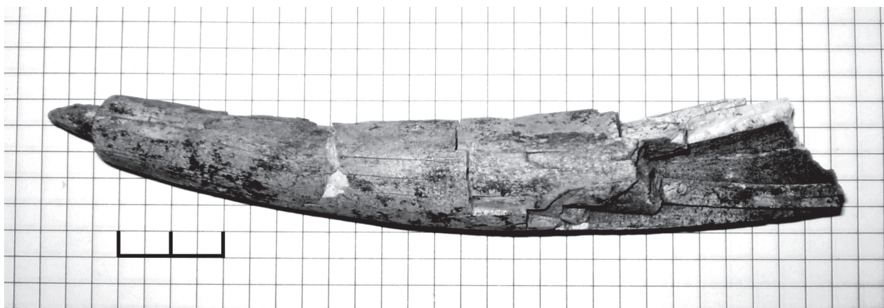
Рис. 1. Загальний вигляд виробу з бивня мамонта.

An artefact made from the young mammoth tusk decorated by compound geometrical ornamental pattern was found on the site Doroshivtsi III, at the Middle Dniester basin. The found decorative pattern differs from the Palaeolithic ornaments known for today. The age of find is estimated approximately up to 25-30 Ky.