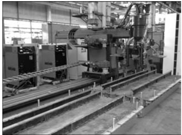
Рис. 1. Общий вид установки АД 380.03М

программируемого контроллера (ПК) типа «CQM1N» с программным обеспечением (ПО ПК) для управления процессом наплавки;