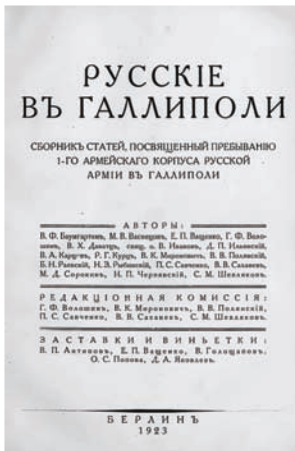
Рис. 3. Титульный лист сборника "Русские в Галлиполи".

создании оказалась заметной и значимой, и в ноябре 1921 г. его включили кандидатом в члены Совета созданного тогда же Общества галлиполийцев.