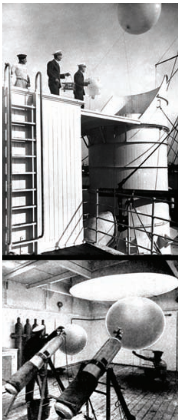
Рис. 4. Запуск метеозонда с парохода Carimare [Ship weather ..., 1938].

После защиты В. К. Миронович перенес внимание как раз на тропосферные пертурбации, особенно вблизи переходного слоя между тропосферой и находящейся выше стратосферой. Этот тонкий слой называют тропопаузой, и там происходит резкое уменьшение вертикального температурного градиента. В полярных райо-