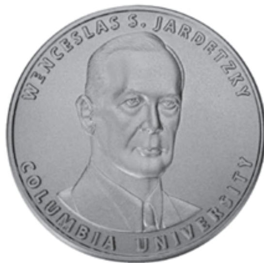
Медаль В. С. Жардецкого

Фундаментальные труды ученого постоянно переиздаются. С 1992 г. по инициативе его сына в Геологической обсерватории Ламонт-Догерти крупнейшие ученые в области наук о Земле ежегодно читают мемориальную лекцию в его честь. Первым из лекторов был многолетний сотрудник и соавтор В. С. Жардецкого — Франк