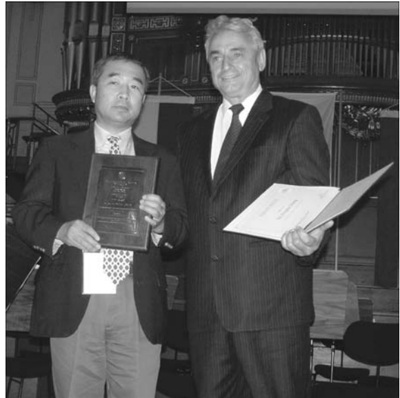
Вручение премии имени Евгения Патона

В настоящее время в МИСе функционирует более 20 комиссий и других структурных подразделений по следующим направлениям: высоко- и низкотемпературная пайка, термическая резка и процессы газопламенной обработки; дуговая сварка и сварочные материалы; сварка сопротивлением и холодная сварка, а также родственные процессы соединения материалов; лучевые способы сварки; контроль и обеспечение качества сварных конструкций; терминология; охрана труда; поведение металлов при сварке; сварные конструкции, предотвращение разрушения; сосуды, работающие под давлением, котлы и трубы; дуговые сварочные процессы и технологии; усталостная прочность сварных узлов и конструкций; обучение и подготовка; конструирование, анализ и производство сварных конструкций; сварка полимеров и технологии клейки; обучение, подготовка и аттестация; внедрение и аккредитация; неразъемные соединения для новых материалов и покрытий для авиастроения; автомобильный транспорт; окружающая среда; управление качеством при сварке и родственными технологиями; стандартизация; подводная сварка; физика сварки; стратегия исследований в сварке и сотрудничество. В целом они довольно полно охватывают область сварки во всей ее многогранности, включая этапы исследования,