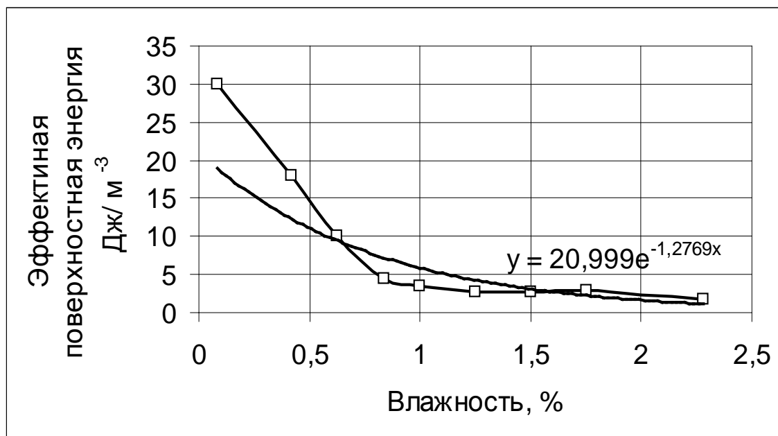
Рис. 3. Зависимость ЭПЭ песчано-глинистых сланцев от их влажности

сопряжена с наличием при отработке и эксплуатации выработок полей повышенных напряжений – зоны повышенного и опорного горного давления.