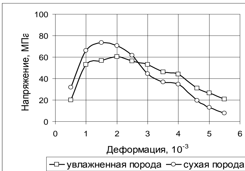
Рис. 1. Зависимости компонентов напряжений от деформаций при деформировании песчано-глинистого сланца в условиях объемного неравнокомпонентного сжатия

3 %. Откуда видно, что наиболее интенсивное снижение прочности происходит при повышении влажности до W = 2,0 %.