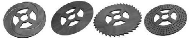
Рис. 2. Варианты профилирования дисков рабочего колеса турбины трения комбинированного турбопривода системы подпитки

При решении первой из указанных выше задач, в результате анализа известных современного уровня техники разработок, было предложено и запатентовано новое техническое решение — комбинированный турбопривод [2], имеющий преимущества по сравнению с традиционно используемыми на АЭС лопаточными паротурбинными приводами. Дело в том, что эффективный оперативный пуск лопаточных турбин требует использования подготовленного (сепарированного) пара. Для обеспечения работы таких турбонасосных агрегатов на влажном паре, отбор которого можно и, более того, целесообразно осуществлять из парогенераторов работающих циркуляционных петель ядерной энергетической установки, в пусковых режимах требуется использование развитой системы сепарации влаги и защиты металла от эрозионно-коррозионного износа. Именно по этой причине в элементах парораспределения и в проточной части традиционно применяемой на АЭС типовой лопаточной турбины Лавала, а также для ободов диафрагм и их разъемов применяются дорогостоящие износоустойчивые стали. Нами было показано, что в рамках альтернативного подхода к техническому обеспечению аварийной подпитки оборудования с помощью турбонасосных агрегатов может рассматриваться применение другого, более простого, усовершенствованного, технического решения, предусматривающего использование турбины трения