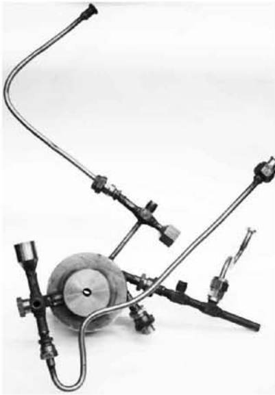
Рис. 4. Стендовый образец экспериментальной турбины трения с оснасткой