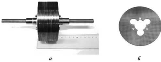
Рис. 1. Опытный образец ротора турбины трения комбинированного турбонасосного агрегата системы подпитки (а) и роторный диск базовой конструкции (б)

При решении первой из указанных выше задач, в результате анализа известных современного уровня техники разработок, было предложено и запатентовано новое техническое решение — комбинированный турбопривод [2], имеющий преимущества по сравнению с традиционно используемыми на АЭС лопаточными паротурбинными приводами. Дело в том, что эффективный оперативный пуск лопаточных турбин требует использования подготовленного (сепарированного) пара. Для обеспечения работы таких турбонасосных агрегатов на влажном паре, отбор которого можно и, более того, целесообразно осуществлять из парогенераторов работающих циркуляционных петель ядерной энергетической установки, в пусковых режимах требуется использование развитой системы сепарации влаги и защиты металла от эрозионно-коррозионного износа. Именно по этой причине в элементах парораспределения и в проточной части традиционно применяемой на АЭС типовой лопаточной турбины Лавала, а также для ободов диафрагм и их разъемов применяются дорогостоящие износоустойчивые стали. Нами было показано, что в рамках альтернативного подхода к техническому обеспечению аварийной подпитки оборудования с помощью турбонасосных агрегатов может рассматриваться применение другого, более простого, усовершенствованного, технического решения, предусматривающего использование турбины трения