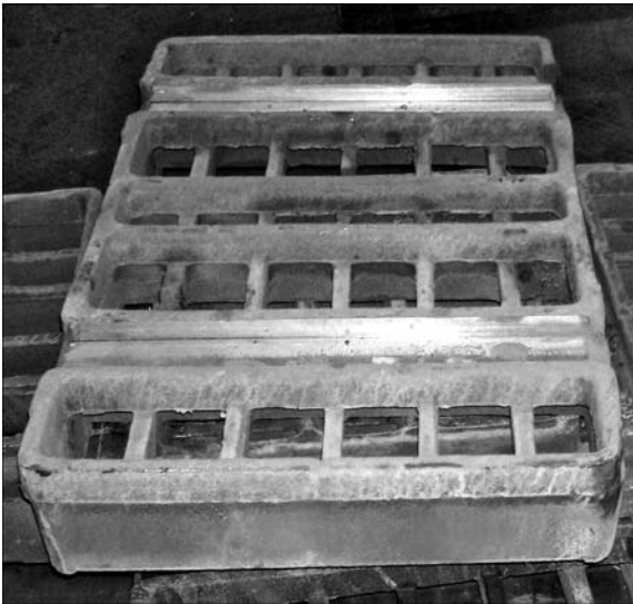
Рис. 4. Вид на поддоны после очистки и механической обработки

отсасываются через слой краски в песок, а затем в вакуумную систему. Металл точно повторяет форму полистирольной модели. Время охлаждения отливки в опоке составляло 20... 25 мин. После охлаждения отливки опоку поворачивали на специальном стенде-кантователе на 180°. Отливка (рис. 3) и песок обычно легко удаляются из опоки. После ее извлечения литниковая система обрезается. Деталь пескоструится от остатков пенополистирола и антипригарной краски.