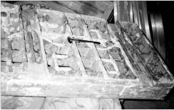
Рис. 3. Заготовка после извлечения из опоки