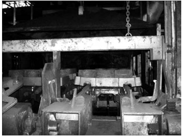
Рис. 5. Поддоны с заготовками штампуемых деталей перед посадкой в термическую печь

Полученная заготовка поддона из жаропрочной стали 20Х20Н14Г2А решетчатой конструкции с основной толщиной ребер 12 мм имела габаритные размеры 610×1000×142 мм, массу 125 кг (рис. 4).