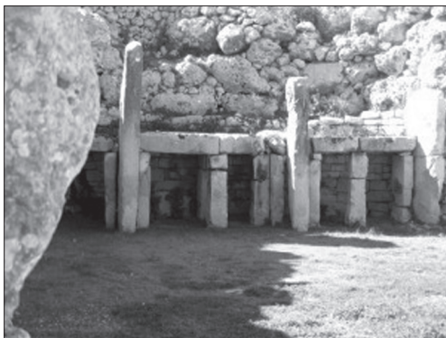
Іл. 3. Мальтійський архіпелаг, острів Мальта: гіпостильний вхід до скельного Храму Гвантія (Ggantija)

храмів також складалася з овальних, яйцеподібних камер, як і в скально-печерному ансамблі Мегалітичного Комплексу в регіоні Дністровського Водосховища в Україні [13, с. 79—82]. Овальна яйцеподібна камера — це своєрідний мегалітичний модуль, визначений ще на початку ХХ ст. англійським морським інженером-будівничим Олександром Томом [1, с. 54—80]. Одночасно, автор наполягає на