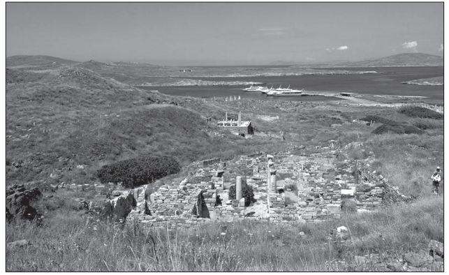
Іл. 4. Греція, острів Делос

Гіпербореї, як свідчать античні джерела найбільш шанували бога Сонця. Ми не знаємо, як називалося це божество у гіпербореїв, але можна припустити, що перша культово-ритуальна споруда, яка була зведена ними, була моделлю для їхніх наступників.