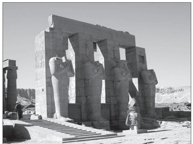
Іл. 6. Єгипет, Карнакський комплекс: зруйнований гіпостильний зал зі статуями фараонів

Спробуємо відшукати підтвердження авторським припущенням в міжетнічній міфології, проаналізувавши деякі аналогії грецьких та давньослов'янських міфів. Ми розглянемо міфи та легенди саме давніх слов'ян, яких ми впевнено можемо ідентифікувати з поселенцями Східно-Європейської платформи та