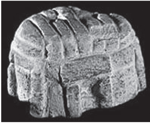
Іл. 1. Мальтійський архіпелаг, острів Мальта: макет храму з храмового комплексу Тарксієн (Tarxien)