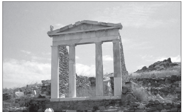
Іл. 5. Греція, острів Делос. Храм Аполлона: руїни з портиком-гіпостилем