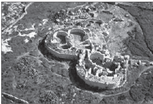
Іл. 2. Мальтійський архіпелаг, острів Мальта: план храмового комплексу Мнайдра (Mnajdra) — типовий план мальтійських храмів