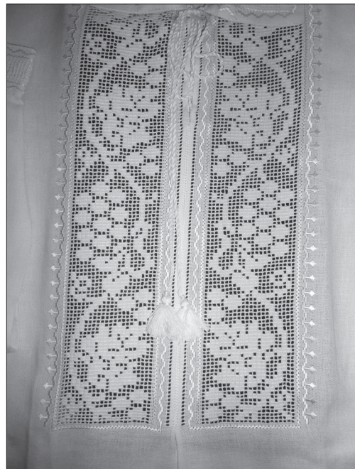
Віра Нестерук. Фрагмент сорочки. Виноградна лоза, техніка — мережка по сітці

бацію у численних міжнародних заходах, зокрема Міжнародних фестивалях: