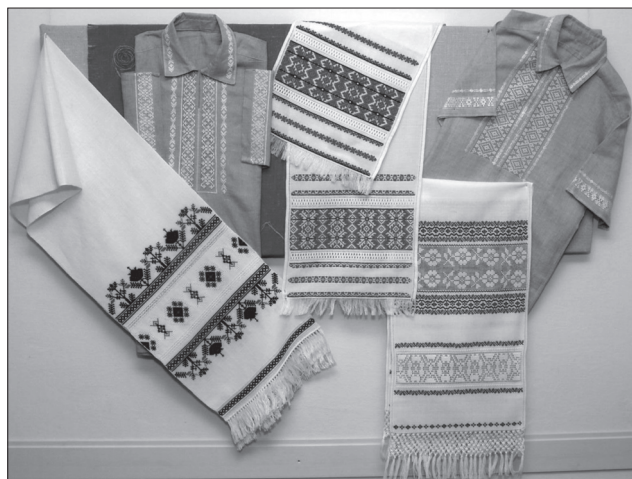
Віра Нестерук. Сорочки. Техніка — поліське продкування, рушники — хрестик, занизування, обманка

села, демонстрація яких започаткована на майданчиках РОКМ. Та й «Красносільські вітряки» — це теж оригінальний мистецький фестиваль, місцем дислокації якого є Гоцанський район Рівненщини.