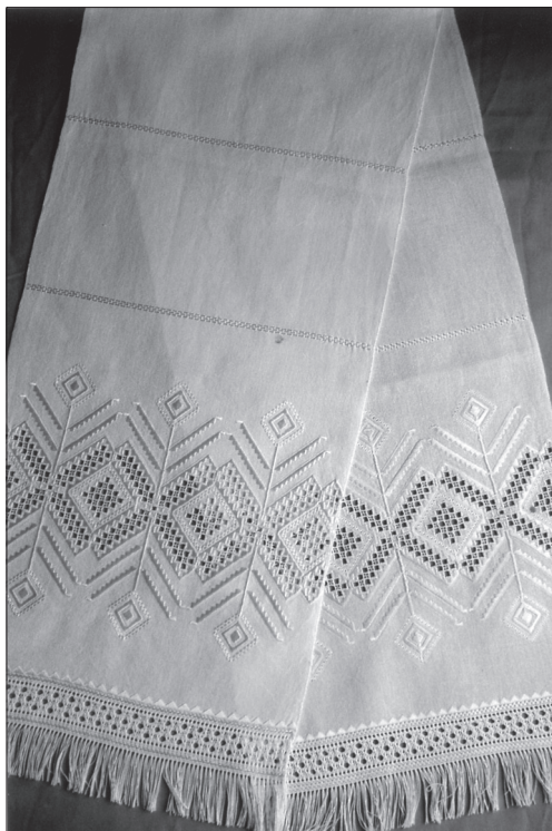
Віра Нестерук. Рушник. Оберіг, техніка вирізування — лічильна гладь, мережка