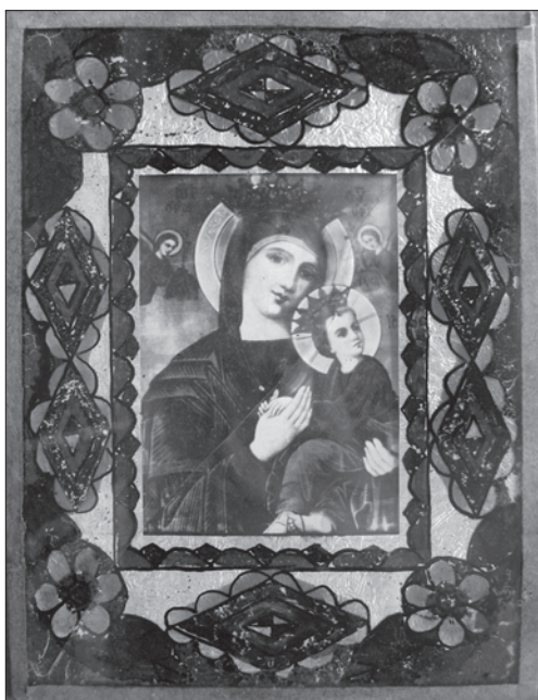
Скляна рамка з декоративним розписом — обрамлення для ікони-фотокопії «Божа Мати Неустанної Помочі». Середина — друга половина ХХ ст., с. Монастирок Борщівського р-ну Тернопільської обл. Фото автора 2011 р.

були такі образки. Се... обмальовували кругом і прикладали образок, і фольга була» 23 . Серед інформа-