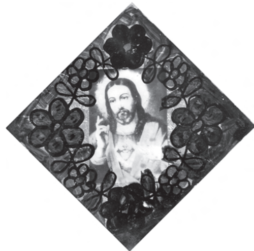
Скляна рамка з декоративним розписом — обрамлення для ікони-фотокопії «Пресвяте Серце Ісуса Христа». Середина — друга половина ХХ ст., с. Монастирок Борщівського р-ну Тернопільської обл. Фото автора 2011 р.

звідти, — як Коломия, як Косів» 40 ; «привозили, певно, з Франківщини» 41 .