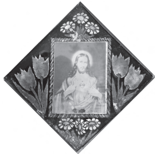
Скляна рамка з декоративним розписом — обрамлення для ікони-фотокопії «Пресвяте Серце Ісуса Христа». Привезена у 1945—1946 рр. зі с. Хотинець Ярославського повіту (тепер — територія Польщі), с. Трійця Борщівського р-ну Тернопільської обл. Фото автора 2011 р.

Крім фіксації артефактів, важливу частину польових досліджень складають результати опитування місцевих мешканців, що дають змогу уточнити хронологічні межі та особливості розвитку «вторинної етномистецької традиції». Її появу респонденти датують кінцем 1930-х — 1940-ми рр. Це підтверджується згадками про продаж творів малярства на склі у 1935—1940 рр. у крамницях міста Бережан 20 ,