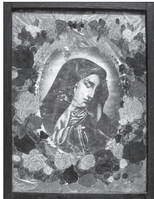
Скляне декоративне обрамлення з розписом для іконофотокопії «Страждальна Мати». Середина — друга половина ХХ ст., с. Щепанів Козівського р-ну Тернопільської обл. Фото автора 2011 р.

на плаче...» (1970—1980-ті); «Різдво Христове», «Свята Родина» (2007—2008) та інші.