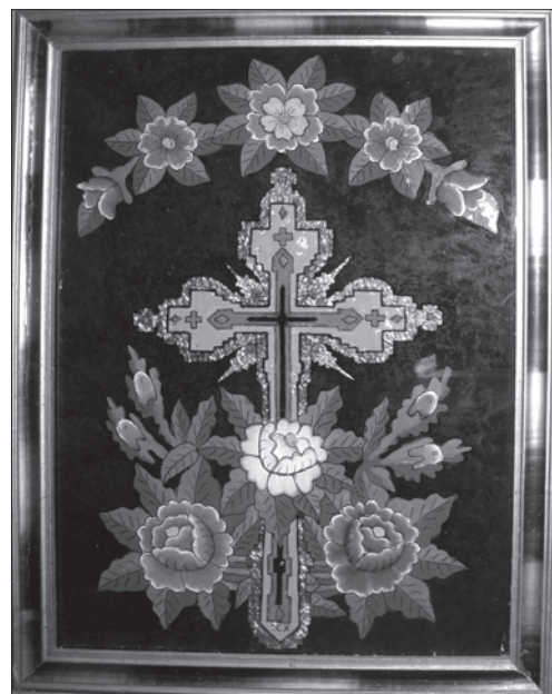
Ікона на склі «Хресту Твоєму поклоняємося, Владико...». Середина — друга половина ХХ ст. зі с. Рудники Підгаєцького р-ну. Підгаєцький районний краєзнавчий музей.