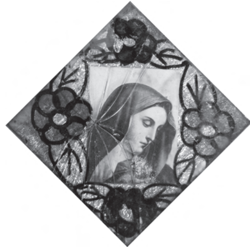
Скляна рамка з декоративним розписом — обрамлення для ікони-фотокопії «Страждальна Мати». Середина — друга половина ХХ ст., с. Шутроминці Заліщицького р-ну Тернопільської обл. Фото автора 2011 р.