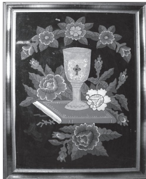
Ікона на склі «Пресвята Євхаристія» («Чаша і Євангелія»). Середина — друга половина ХХ ст. зі с. Рудники Підгаєцького р-ну. Підгаєцький районний краєзнавчий музей. Фото автора 2011 р.