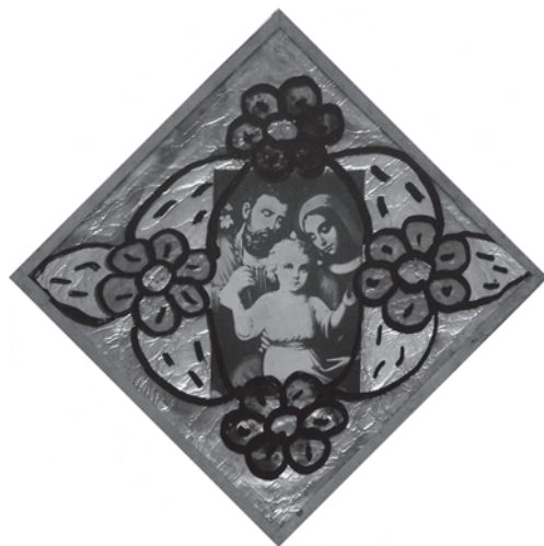
Скляна рамка з декоративним розписом — обрамлення для ікони-фотокопії «Свята Родина». Середина — друга половина ХХ ст., с. Губин Бучацького р-ну Тернопільської обл. Фото автора 2011 р.

побутування мальованих на склі рамок у 1939-му — 1940-х рр. у с. Космирин 21 та у 1939 р. у с. Вербівка 22 . Розповідь респондентки 1926 р. н. свідчить про поширення цих творів у кінці 1930 — на початку 1940-х рр: «Як я ще дівчиною була, підлітком, —