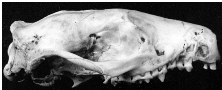
Рис. 3. Разрушение костной ткани верхней челюсти: корни зубов (1), перфорация (2). Fig. 3. Demolition of bony tissue of the upper jaw: roots of teeth (1), perforation (2).

Очевидно, что дальнейшее метастазирование приводит к гибели ежа. Кроме того, в данном черепе — правосторонний экзостоз скуловой дуги (рис. 2, 2), что свидетельствует о нарушении обмена солей кальция.