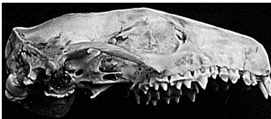
Рис. 4. Вздутие верхней челюсти с округлой перфорацией (1).