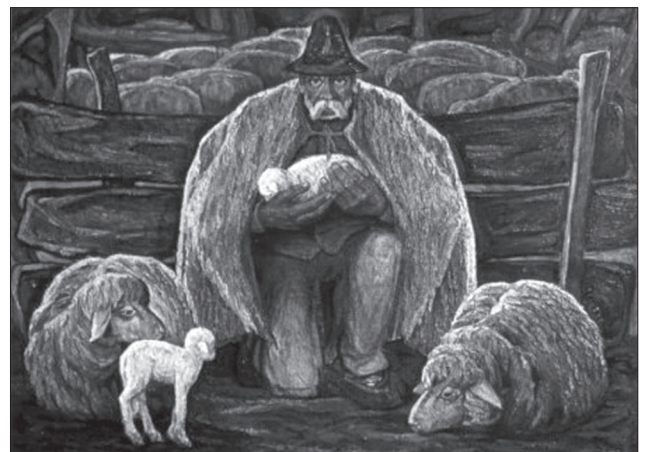
Володимир Микита. Ягнятко. 1969

площинне трактування кольору, поперемінність контрастних теплих та холодних відтінків, що відтворюється в загальному площинному вимірі, ніби композиція народного килиму або декоративного панно. Спостерігаються характерні авторські формотворчі риси констатації об'єктів, властиві митцю. Еліпсоподібні конфігурації ландшафтної поверхні гармонійно переходять у моделювання округлими лініями колоподібних крон дерев, що, в свою чергу, інтегруються в закруглені обриси гірських схилів і переходять в округлі силуети хмар. Автор свідомо позбавився академічних зобов'язань тривимірного