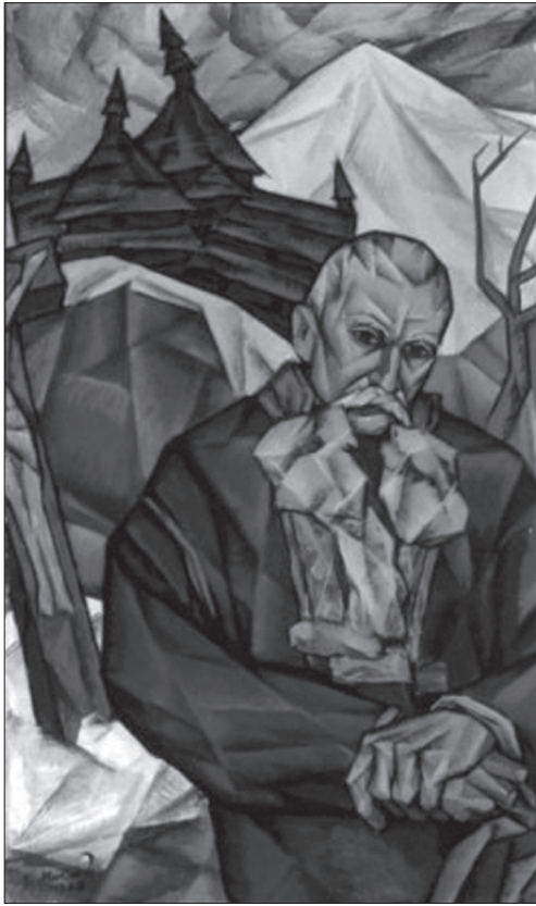
Володимир Микита. Смуток. 1966