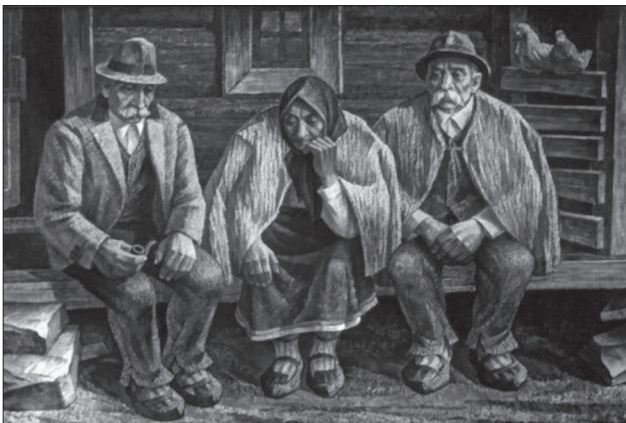
Володимир Микита. На порозі вічного. 1995

рактистик, при всій різноманітності емоційних станів несподівано приходить розуміння того, що це, одночасно, ще й якась єдина особа. Ми маємо справу і з виходом на певну об'єктивність через якесь радикальне узагальнення: «Збірний образ верховинця» наскрізні теми і одночасно потужні стійкі пластичні символи — згустки сенсу, уособлені уявлення, чуттєво-зримі ідеї — універсалії. Одна особа проглядає у багатьох роботах, — знакове втілення ідеї Особи в цілому як такого. Саме при такому підході до фольклорної творчості особистість художника розчиняється в канонізованих смислових і образотворчих моделях.