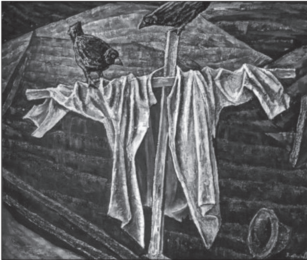
Володимир Микита. Пужало. 1981