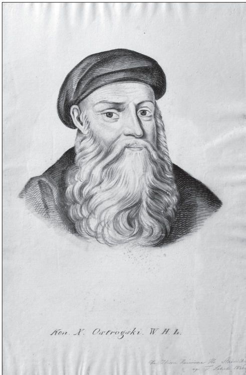
Лобеський Ф. Князь, великий гетьман литовський Костянтин Острозький. (Тонований папір, вугілля; 1850 р.)

Раймонд Єзерський (1698—1782)», «Художник Францішек Жиглінський (1816—1849)», «Єпископ Лукаш Калинський (1565—1633)», «Св. Ян Канти (1390—1473)», «Єпископ, ректор Львівського університету Каетан Ігнацій Кіцький (1740—1812)», «Великий коронний гетьман Станіслав Конєцпольський (1592—1646)», «Вчений, астроном Микола Коперник (1473—1543)», «Архієпископ Ігнацій Красицький (1735—1801)», «Архієпископ Костянтин Самуель Ліпський (1622—1698)», «Ігнацій Лось (пом. 1850)», «Єпископ Казимир Лубенський (1642—1719)», «Архієпископ Матвій Лубенський (1572—1652)», «Єпископ Станіслав Лубенський (1573—1640)», «Титулярний архієпископ Єжи Ієронім Марія Войцех Ляскарис (1706—1795)», «Професор Краківського університету Ян Львовчик (Леополіта) (1482—1536)», «Вчений, професор Краківського університету Матвій Меховіта (1457—1523)», «Петрус Мілевський», «Князь, великий гетьман литовський Костянтин Острозький (1460—1530)», «Каштелян Павло Ян Сераковський (пом. 1711 р.)», «Каштелян Ян Сераковський (пом. до 1684 р.)», «Композитор, музичний критик Юзеф Сікорський (1813—1890)» (?), «Адам Дембно-Тимкович Чайковський (пом. 1620 р.)»,