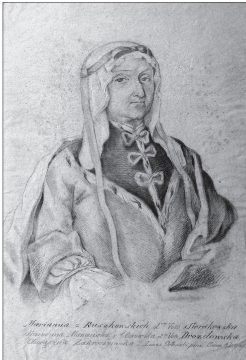
Лобеський Ф. Маріанна Сераковська-Дроздовська. (Тонований папір, вугілля, білило; [1851 р.]

1753—1757). Цьому твердженню суперечать декілька фактів, зокрема, «Портрет короля Польщі Станіслава II Августа Понятовського (1732—1798)» створений на основі мідьориту «Станіслав Август Понятовський» (1778) венеціанського художника другої половини XVIII ст. Бартоломія де Фолліна. Відомо, що гравер відштовхувався від живописного полотна М. Бачареллі, який неодноразово малював короля. Не менш показовим у цьому плані є інший момент. Один із згаданих 40 портретів — «Портрет Миколи Зебжидовського (1553—1630)» — намалював львівський художник Юзеф Райхан [1, арк. 134], який, як відомо, приїхав до Львова з Варшави, де, вірогідно, навчався у М. Бачареллі. Авторство митця підтверджує його підпис на тильному боці полотна. Цей факт дає змогу зробити припущення, що автором усіх інших робіт міг бути Ю. Райхан, а не М. Бачареллі. Цю думку може підтвердити творчий шлях митця, зокрема виконання на початку XIX ст. портретів чотирьох дітей Антонія Стадницького, батька Казимира [27, s. 304]. Інші портрети, які походили зі збірки К. Стадницького, також були копіями, за винятком хіба що «Портрета князя Станіслава Яблоновського», діда К. Стадницького. Його намалював невідомий німецький художник XVIII століття.