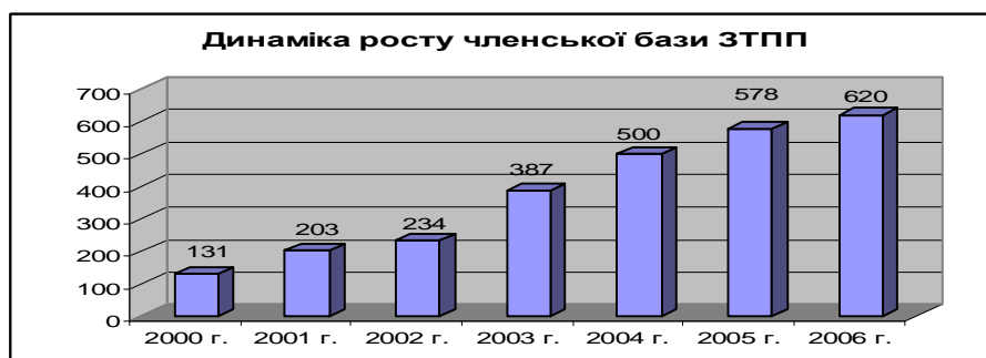
Рис. 1. Динамика роста членской базы ЗТПП

Практически все субъекты внешнеэкономической деятельности являются членами Запорожской ТПП. По итогам 2006 года членская база Запорожской ТПП составляет 620 предприятий.