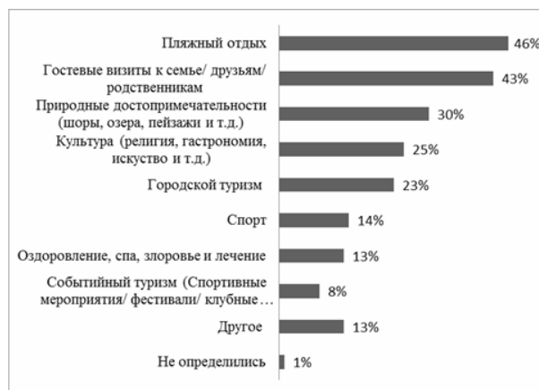
Рис. 1. Мотивы выбора места отдыха европейскими туристами в 2013 г.

По данным ВТО на долю культурного туризма приходится от 37 до 40 % всех международных поездок [13]. По данным Европейской комиссии, в 2013 году среди основных мотивов по выбору места отдыха европейскими туристами, культурные мотивы занимают 25 % – четвертую позицию, следуя за пляжным отдыхом, визитами к родным и друзьям и посещением природных достопримечательностей (рис. 1). [14]