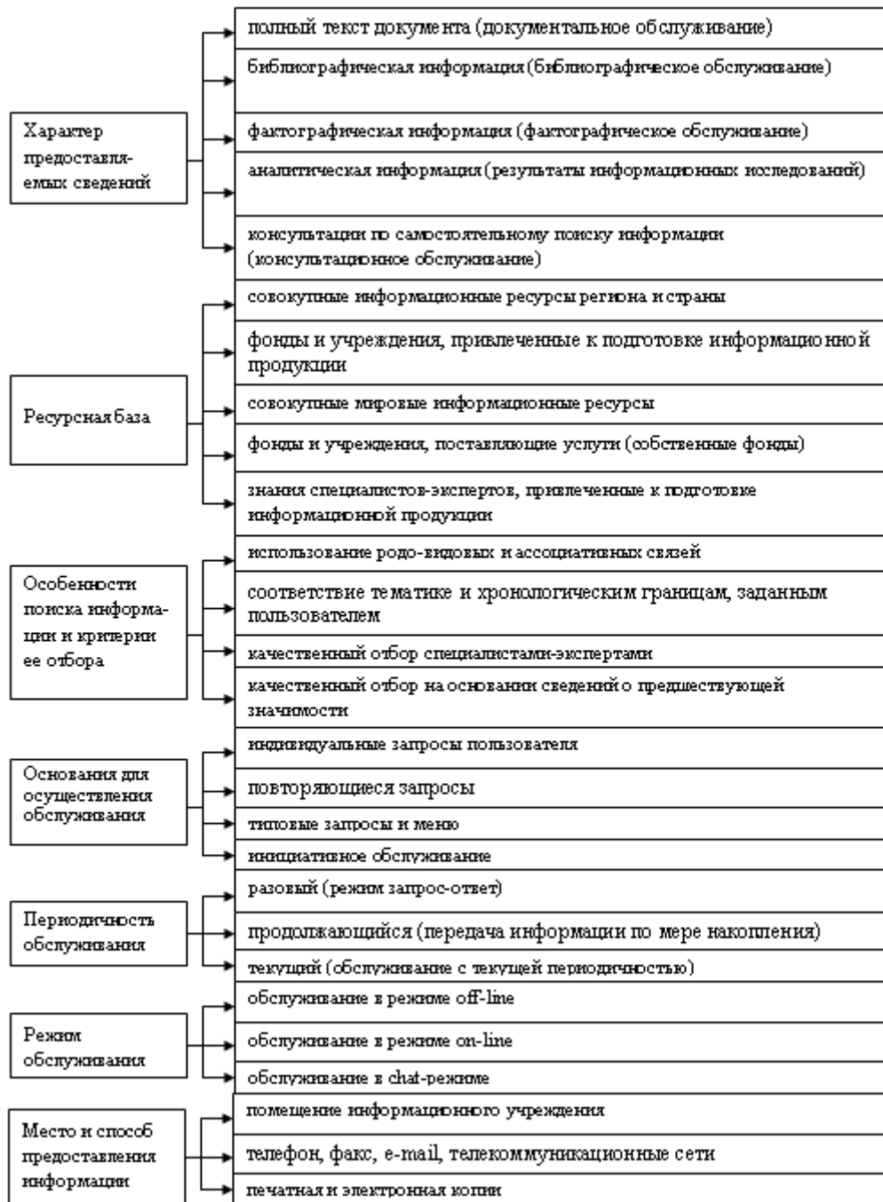
Рис.2. Особенности и критерии классификации информации

В. Кутуков [3] полагает, что корпоративные информационные системы (КИС) являются ядром для создания предприятий, поскольку именно они, автоматизируя и оптимизируя процессы взаимодействия между подразделениями внутри предприятия, позволяют эффективно организовать взаимодействие с клиентами.